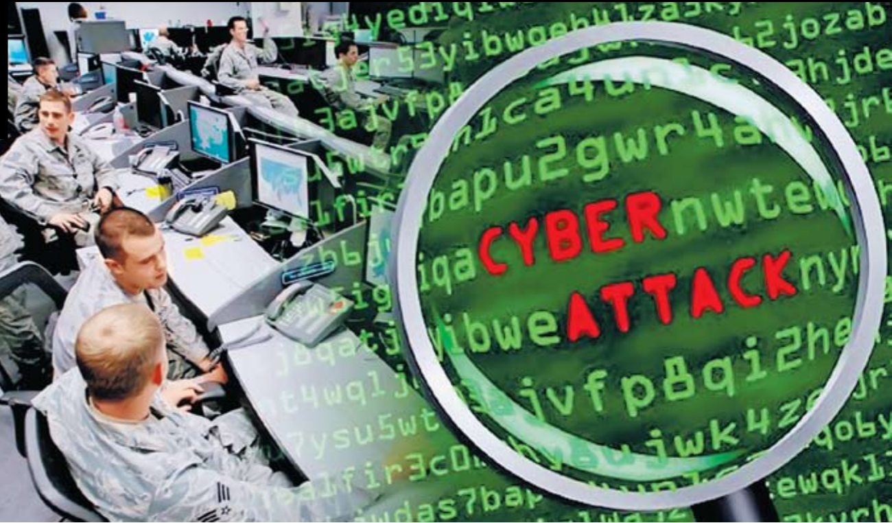
Коллаж: Андрей СЕДУХ

Одним из факторов, способствующих дестабилизации обстановки внутри страны, является слабо контролируемые иммиграционные процессы. В Ливии, например, основной состав повстанческих отрядов составили гастарбайтеры. Соответствующие спецслужбы внедряли в их среду, в том числе в состав частных военных формирований, своих людей. Например, один из командиров повстанцев в ливийском городе Дэрн был Хасади, который до этого был арестован в Афганистане американцами.