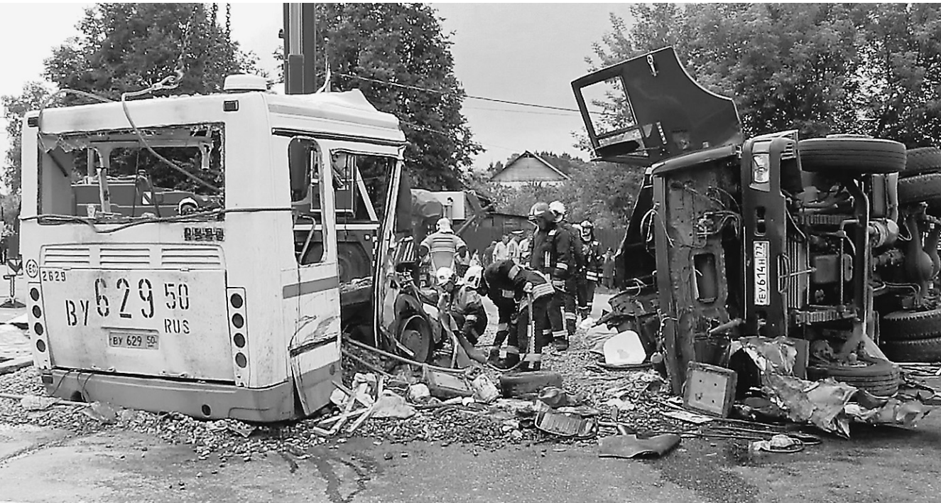
Страшное ДТП в «новой Москве» выявило проблемы с национальными водительскими удостоверениями