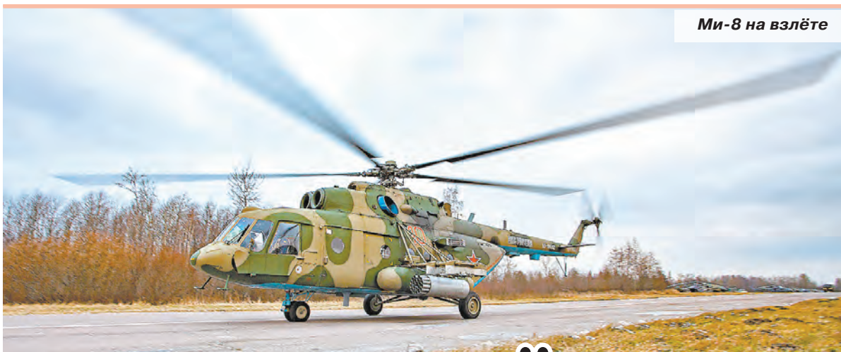
Ми-8 на взлёте