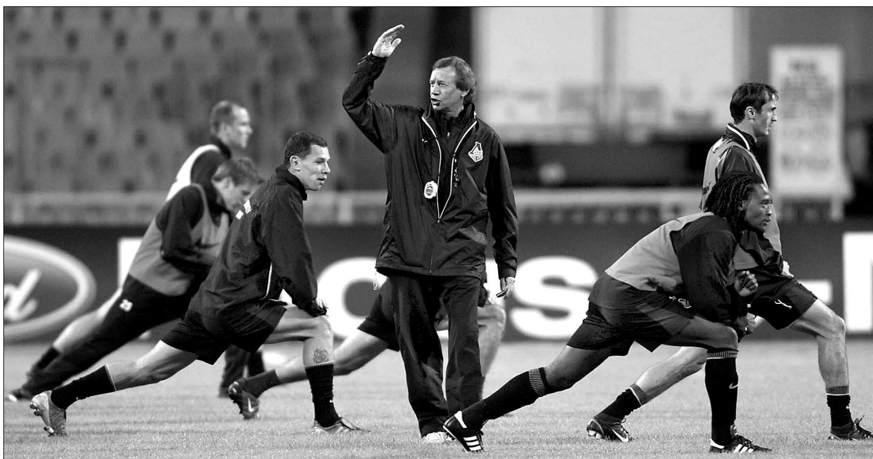
Вчера. Киев. НСК «Олимпийский». Вечерняя тренировка «Локомотива».

Девять лет назад «Спартак» проиграл. Надеемся, сегодня все сложится по-другому.