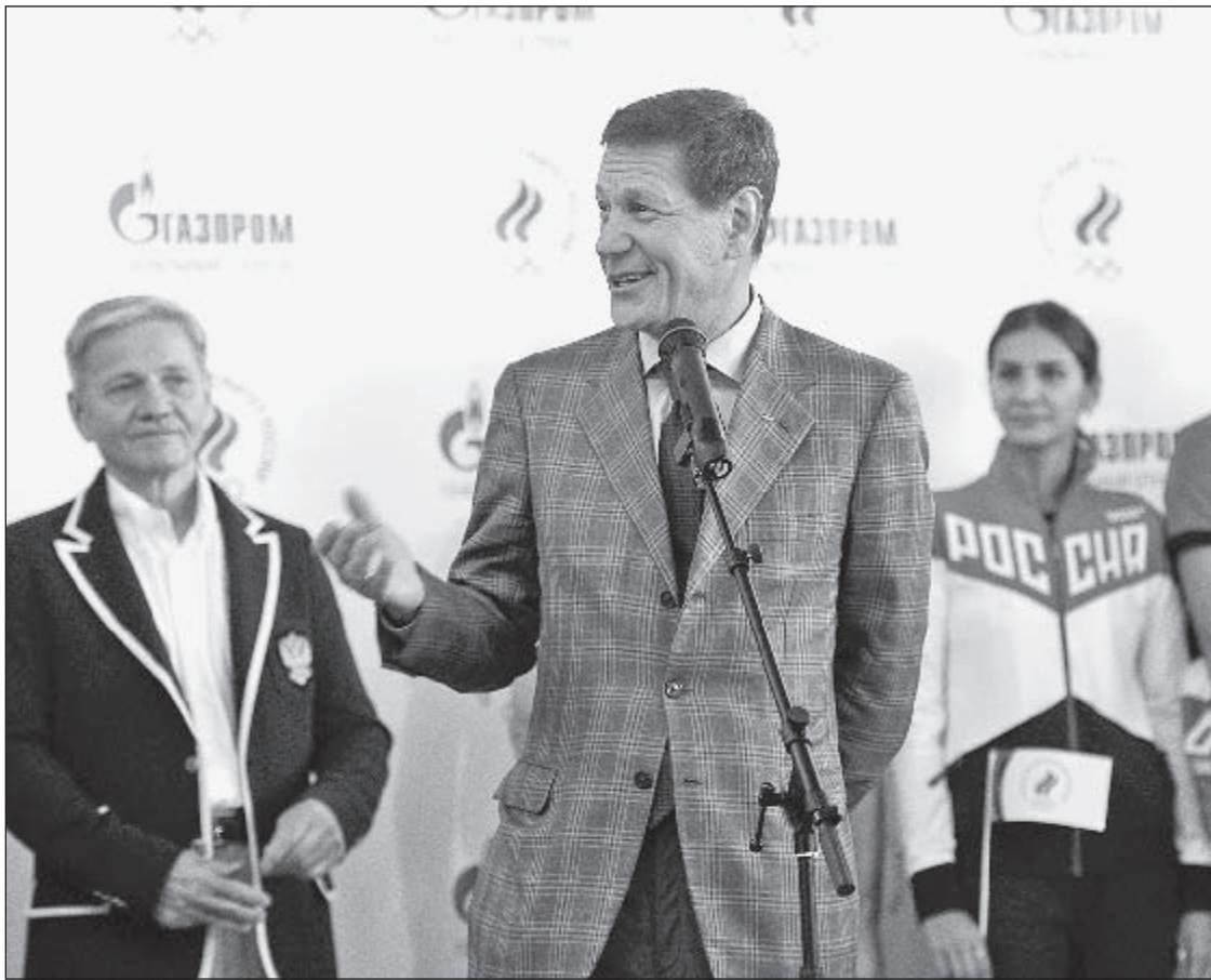
Александр ФЕДОРОВ «СЭ»

Глава ОКР Александр Жуков перед вылетом национальной команды на Олимпийские игры в Рио-де-Жанейро заявил, что окончательный состав сборной на Игры будет объявлен 30-31 июля. - Процедура утверждения не завершена еще ни по одному спортсмену, потому что международные федерации определяют списки, - отметил Жуков. - То, что они одобрили, - порядка 270 спортсменов. Теперь арбитры CAS должны все одобрить. По нескольким федерациям еще идет работа: по академической гребле еще нет ясности, по баядаркам и каноэ. Ждут решения меньше 100 человек.