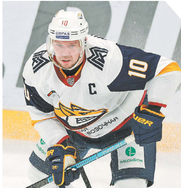
Дарья Исаева «СЗ» / Canon EOS-1D X Mark II