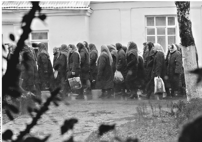
В основном на выход с вещами пойдут женщины

Согласно направленным в МВД и ФСИН документам, досрочно покинуть места заключения смогут беременные женщины и женщины старше 55 лет, а также матери несовершеннолетних детей; мужчины старше 60 лет или с детьми в возрасте до трех лет; инвалиды I, II и III группы. Но только в том слу-