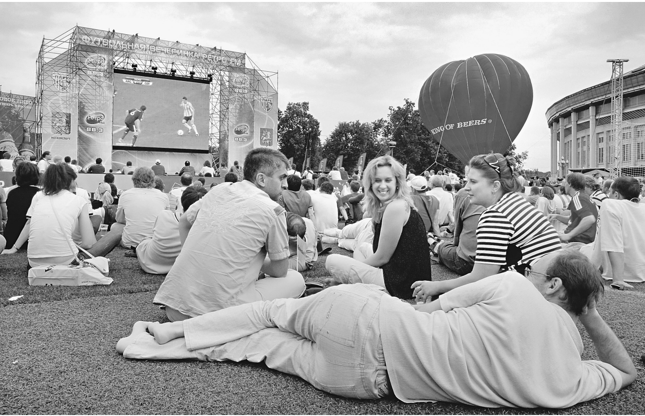
Опыт фан-зон-2012 признан в целом удачным