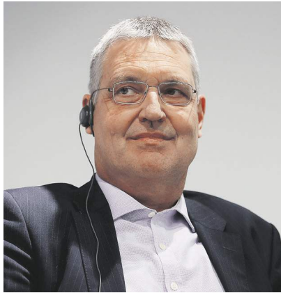
Юлия Корольева | «Известия»

Уходящий год в российско-европейских отношениях обошёлся без инцидентов, которые портили всем кровью годом ранее: вроде событий в Солсбери или в Керченском проливе. Этот год был даже отмечен возвращением российской делегации в ПАСЕ и подвижками в реализации Минских соглашений. Даёт ли это повод наде-