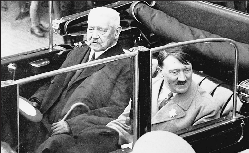
1 мая 1933 года. Берлин. Президент Германии Пауль фон Гинденбург проезжает по улицам города с рейхсканцлером Адольфом Гитлером