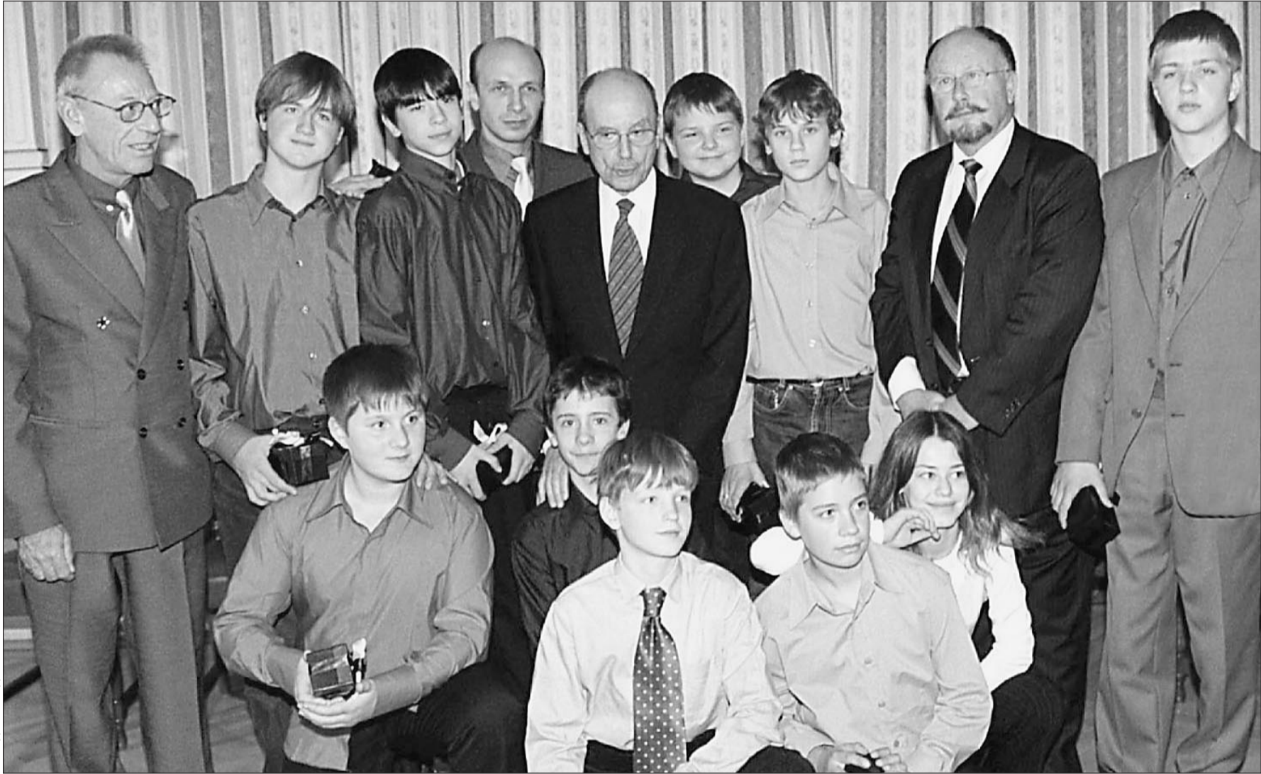
Афины. Дети «Норд-Оста» на приеме у президента Греции Константиноса Стефанопулоса (в центре)

— Самое страшное — возвращение к детям, — признался Владимир Стуканов. — Это чувство испытывал не только я, но и мои коллеги-педагоги. Первые два