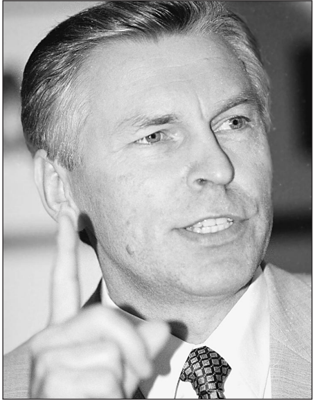
Министр образования Владимир Филиппов

Представители российской интеллигенции, встревоженные планами пересмотра стандартов по литературе, обратились к министру образования Российской Федерации Владимиру Филиппову