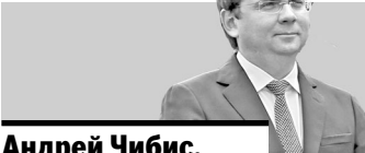
Андрей Чибис, заместитель министра строительства и ЖКХ РФ