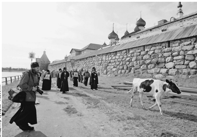
Опыт Соловецкого монастыря — лучшее доказательство способности православных блюсти экологию

Главная особенность — никакой политики, что прису-