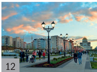
12 Портрет региона