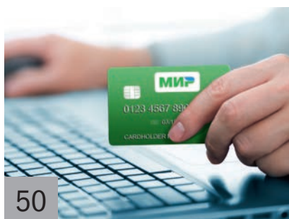
50 От казначейства