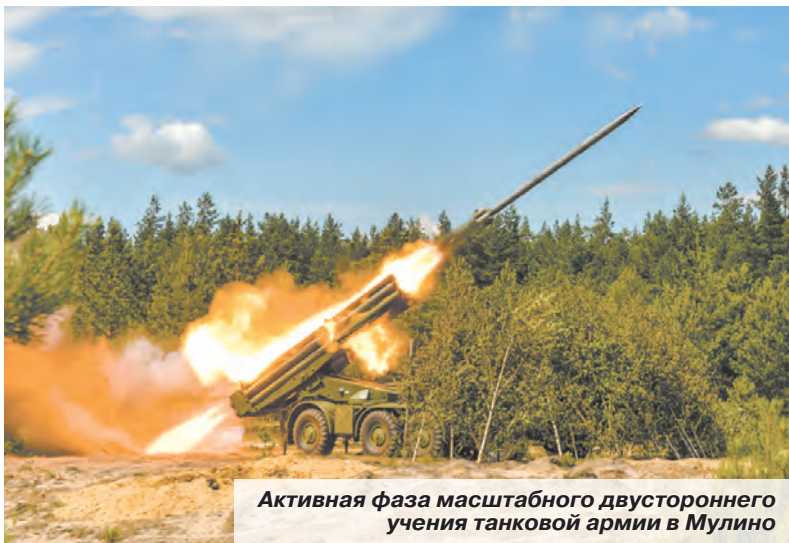
Активная фаза масштабного двустороннего учения танковой армии в Мулино

ронеже) практически отработаны вопросы по управлению частями дивизии при ведении наступательных действий с использованием средств единой системы