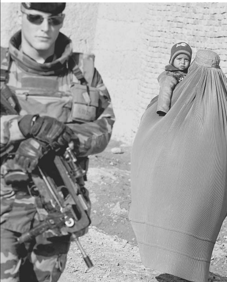
Кабул: Западу и Востоку — явно не по пути

явили: стратегия США в регионе обречена на провал, а талибов победить невозможно. Среди экспертов звучат предположения, что в антитеррористической коалиции назревает раскол, а некоторые ее участники уже вступили с противником в «сепаратные переговоры». → стр. 5