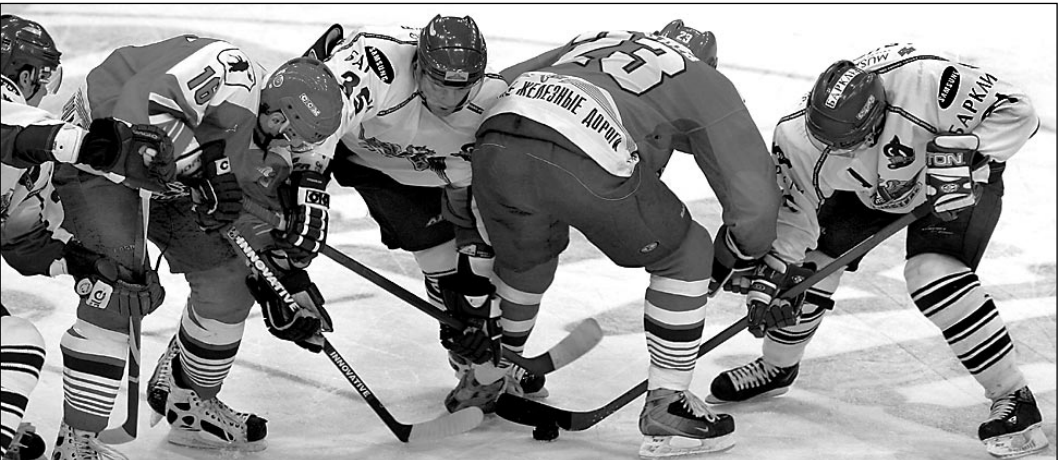
Вчера. Москва. МСА «Лужники». «Динамо» - «Локомотив» - 0:0. Соперники очень дорожили шайбой, и голов в этом матче болельщики в итоге так и не увидели.

«Северсталь» вернула себе лидерство - пусть и не единоличное, - воспользовавшись домашней ничьей «Динамо» с «Локомотивом»