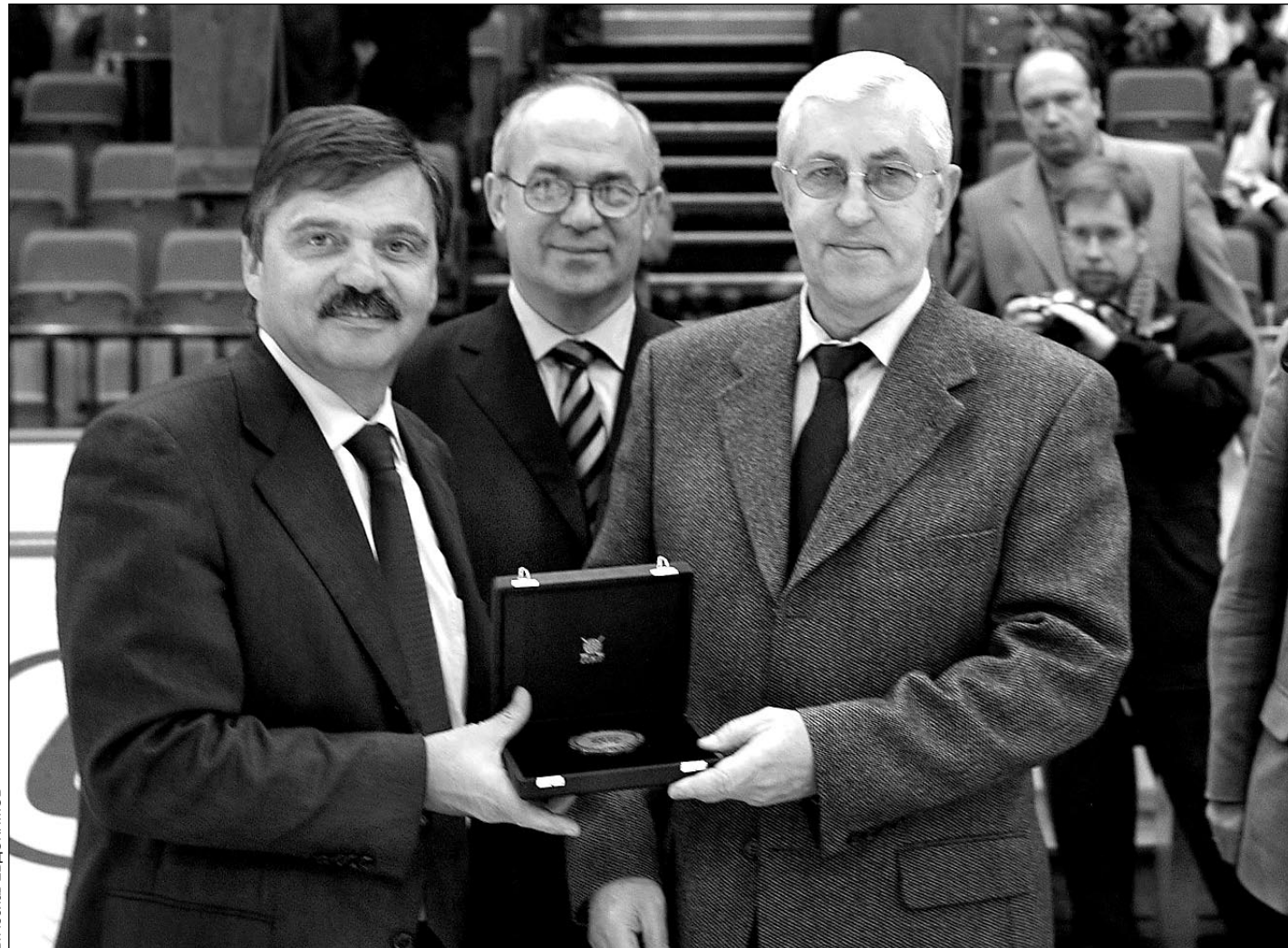
Вчера. Санкт-Петербург. Ледовый дворец. СКА - «Нефтехимик» - 0:0. Заслуги Бориса МИХАЙЛОВА (в центре) перед мировым хоккеем отметил почетной медалью президент ИИХФ Рене ФАЗЕЛЬ (на переднем плане - слева).

Вот только команда вновь не порадовала своего тренера-юбиляра. Правда, если после подарка Юрзинова СКА два дня назад проиграл («Ак Барсу» - 1:3), то на этот раз питерцы довольствовались нулевой ничьей с «Нефтехимиком». Им так и не удалось вернуться в первую восьмерку, в которой они находились долгое время и которая, напомним, дает право участвовать в плей-офф.