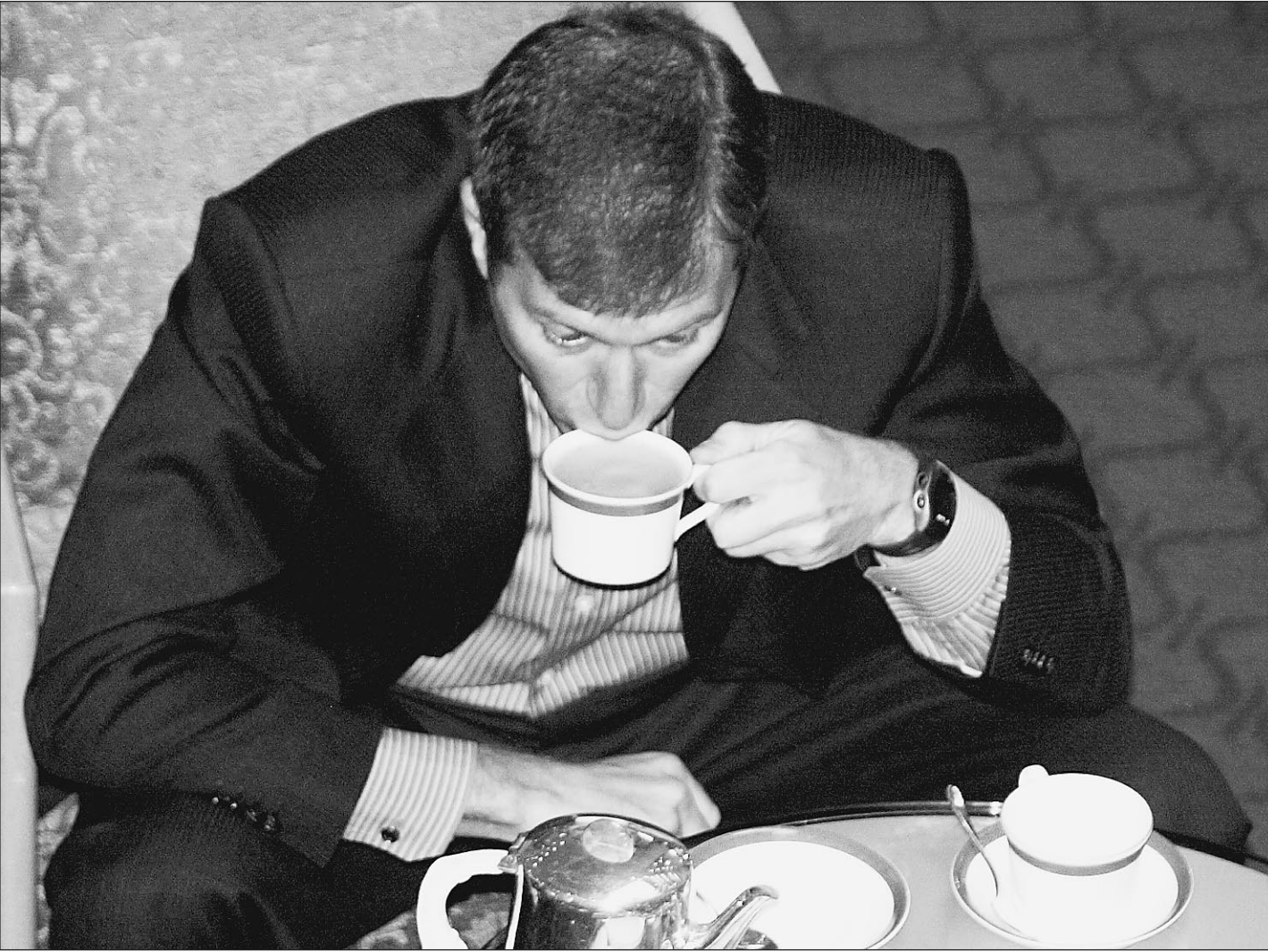
Роман Абрамович. Чукотка. Чайник. Чашка. Чай. «Челси»

Согласно информации Daily Mail, Абрамович контактировал с акционерами «Арсенала», «Тоттен-