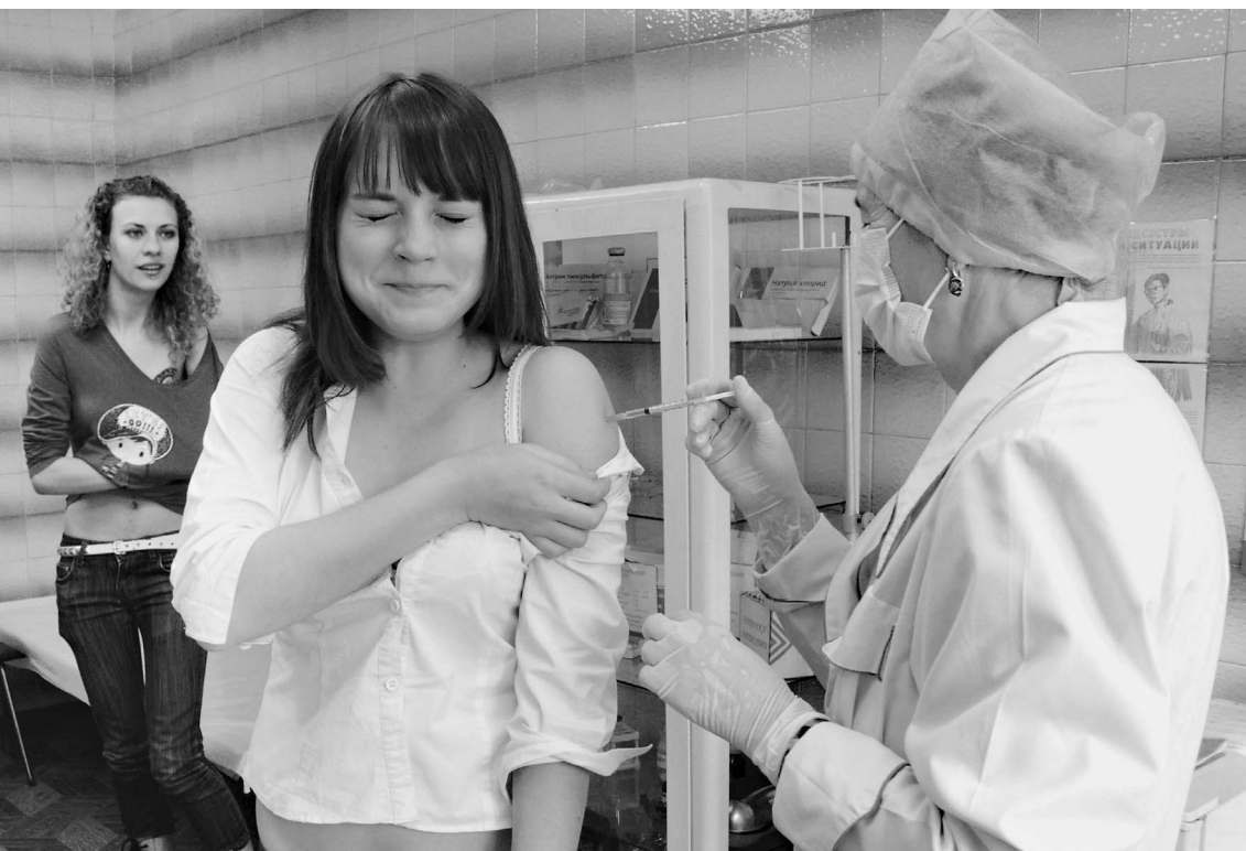
На этой неделе в России началась массовая вакцинация

В Москве и Московской области, по некоторым данным, за последние полторы недели как минимум 4 человека погибли от высокопатогенного вируса A/H1N1. Из них трое буквально на днях. Вирус вырвался за МКАД: в Орехово-Зуеве скончался рабочий столичного метрополитена (возможно, это первая жертва свиного гриппа в Московской области.) Молодая женщина умерла в Зеленограде. Не исключено, что и это неполные данные: в Морозовской детской клинической больнице от воспаления легких умерла школьница. Вскрытие не проводилось, но медики не исключают, что у больной в организме был вирус A/H1N1. При этом столица полнится слухами — вокруг свиного гриппа сложилась настоящая информационная блокада. → стр. 3