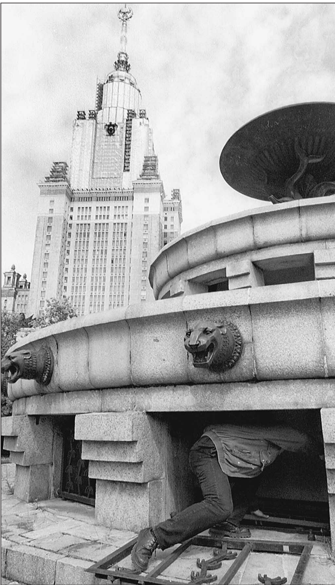
В мир знаний часто проникают окольными путями

— В основном преподаватели вузов попадают на мелких взятках ($20—100) за сдачу зачетов и экзаменов сессии, — сообщили нам в Генеральной прокуратуре. — Крупные взятки за поступление в вуз — один из самых латентных (скрытых) видов преступлений.