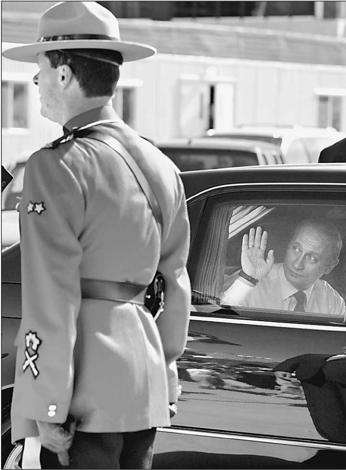
27 июня. Канада. Саммит. Путин