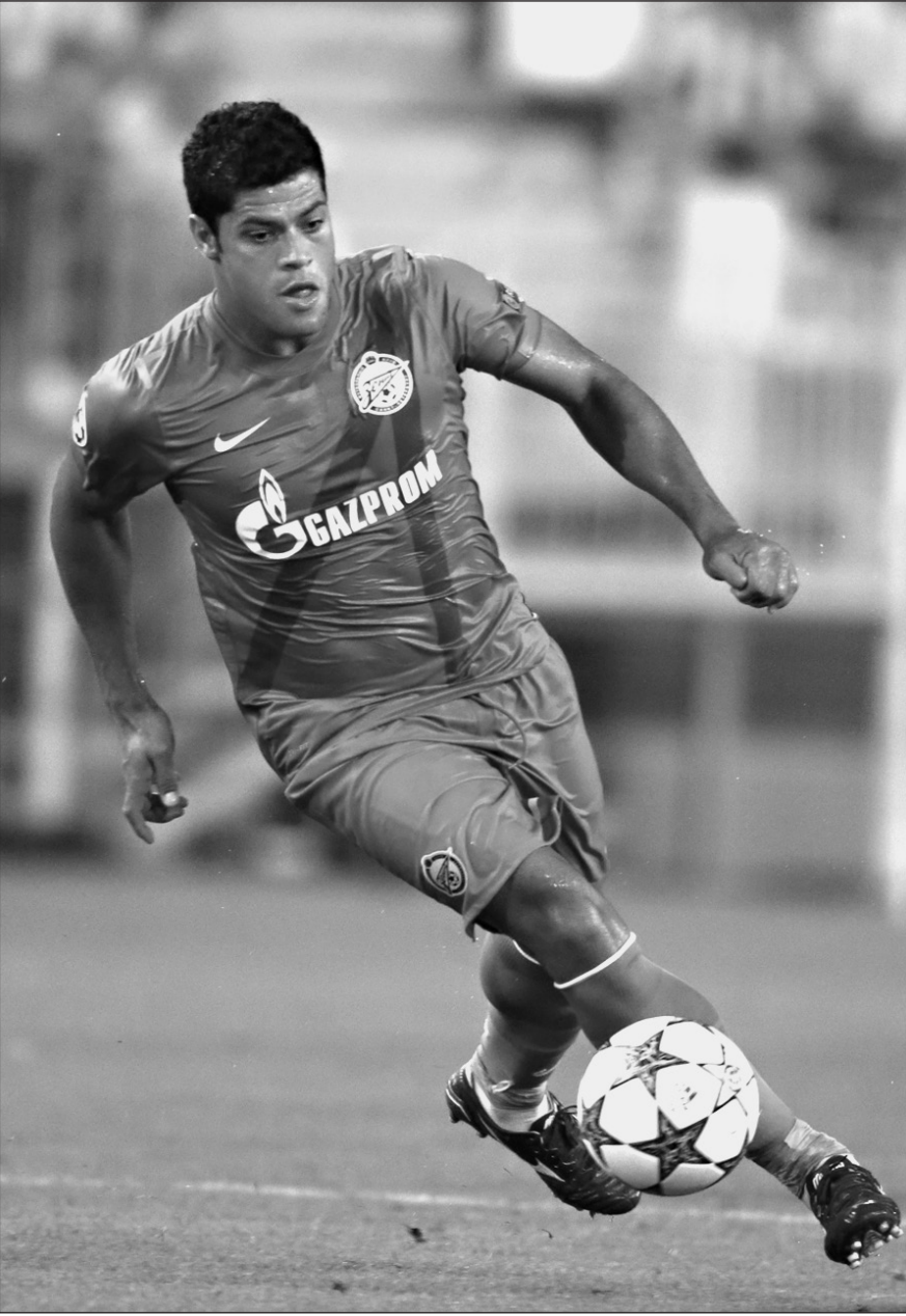
Баскетball БИДКОМОВ ОК «Зенит»

Думаю, это будет по-настоящему мужской матч. А такой футбол уж точно дороже денег.