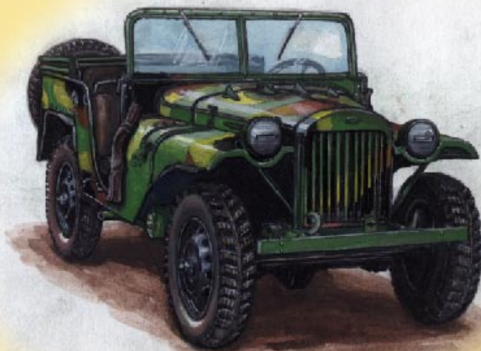
Газ - 64