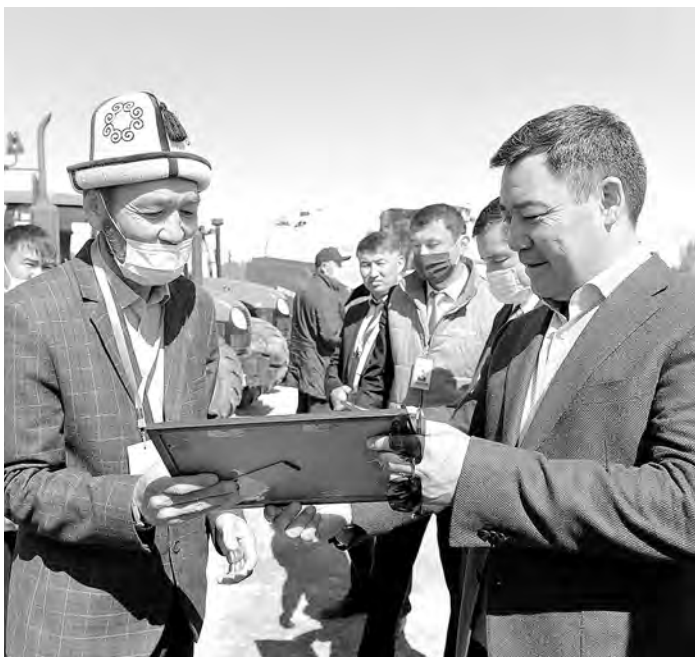
ПРЕСС-СЛУЖБА ПРЕЗИДЕНТА КР

Еще один проект, связанный с животноводческой отраслью, запущен при участии главы республики в областной столице — городе Караколе. Речь идет о мясокомбинате, который, как утверждают официальные источники, стал крупнейшим в стране. Производственная мощность предприятия составляет