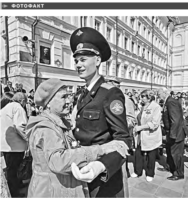
Традиционный праздник под открытым небом «Вальс Победы» состоялся одновременно во всех городах и райцентрах Оренбуржья. Участниками акции стали около 40 000 человек. В областном центре на набережной в майском вальсе кружились 10 000 юношей и девушек – учащиеся школ и колледжей, кадеты, студенты вузов. Они почтили память погибших фронтовиков минутой молчания и запустили в небо голубые шары.