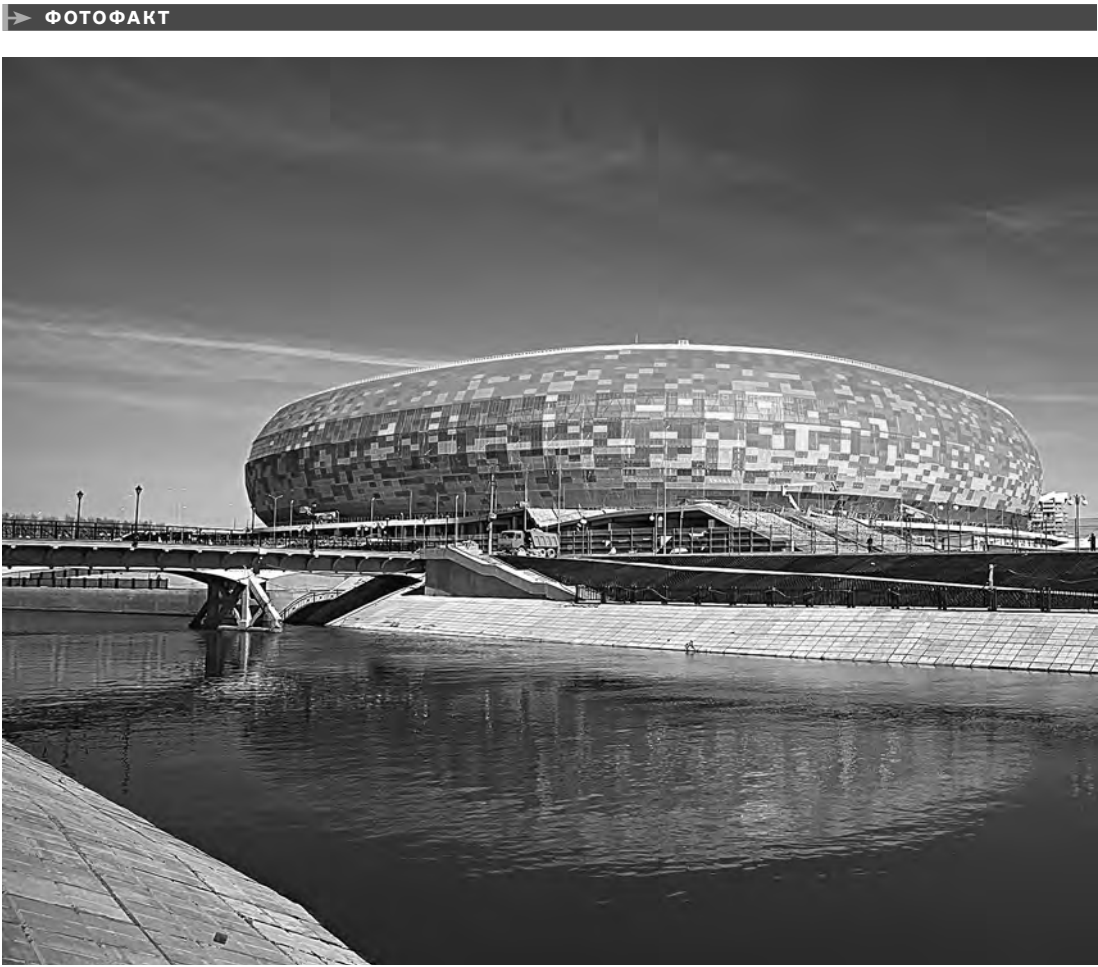
НОВАЯ архитектурной достопримечательностью Саранска и любимым местом прогулок горожан стала набережная близ построенного к чемпионату мира-2018 стадиона «Мордовия Арена». Строители расширили и основательно почистили русло реки Инсар, укрепили берега. Рядом оборудованы велодорожки и спортплощадки.