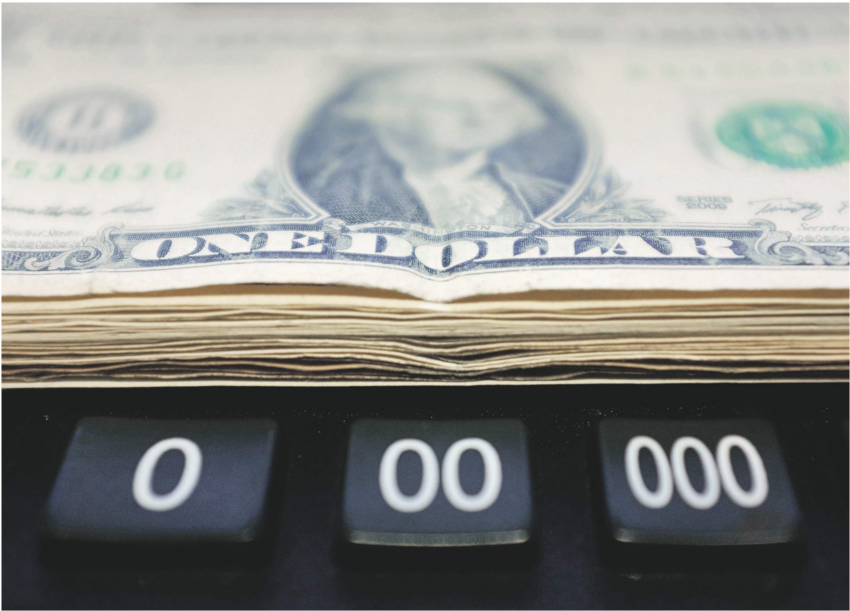
Наталия Соколовская / РИА Новости