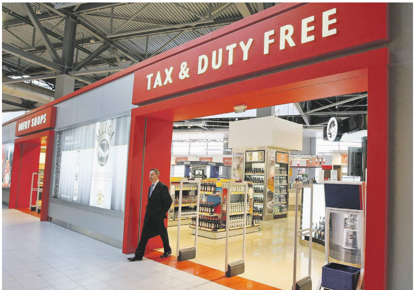
Александр Илюцкий / РИА Новости