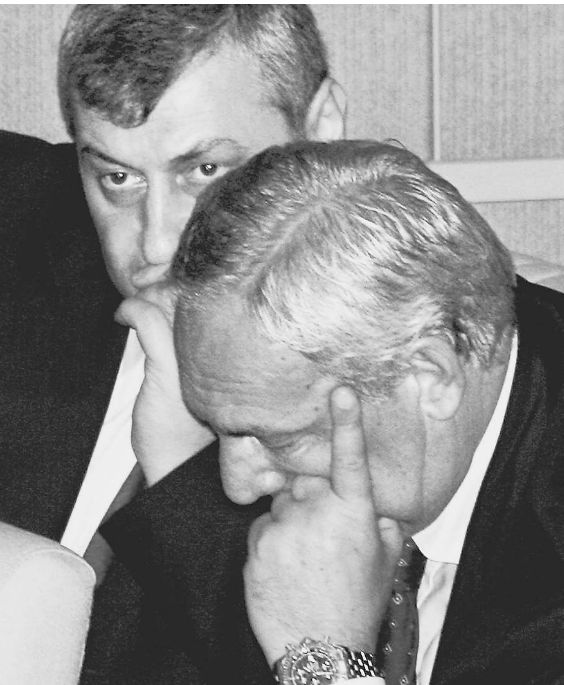
Президент Южной Осетии Эдуард Кокоейт (слева) и его абхазский коллега Сергей Багапш готовятся выступить с трибуны ООН

Представители Абхазии и Южной Осетии собираются в США, где рассчитывают впервые принять участие в заседании Совета Безопасности — по ситуации вокруг Грузии. В штаб-квартире ООН «принципиально одобрили» расширенный состав участников заседания, предложенный Россией. Однако, как заявил накануне нынешний председатель Совбеза ООН, постпред Буркина-Фасо Мишель Кафандо, сроки и формат такого заседания пока не определены. Все будет зависеть от итогов встречи Дмитрия Медведева и Николя Саркози, которая состоится в Москве 8 сентября.