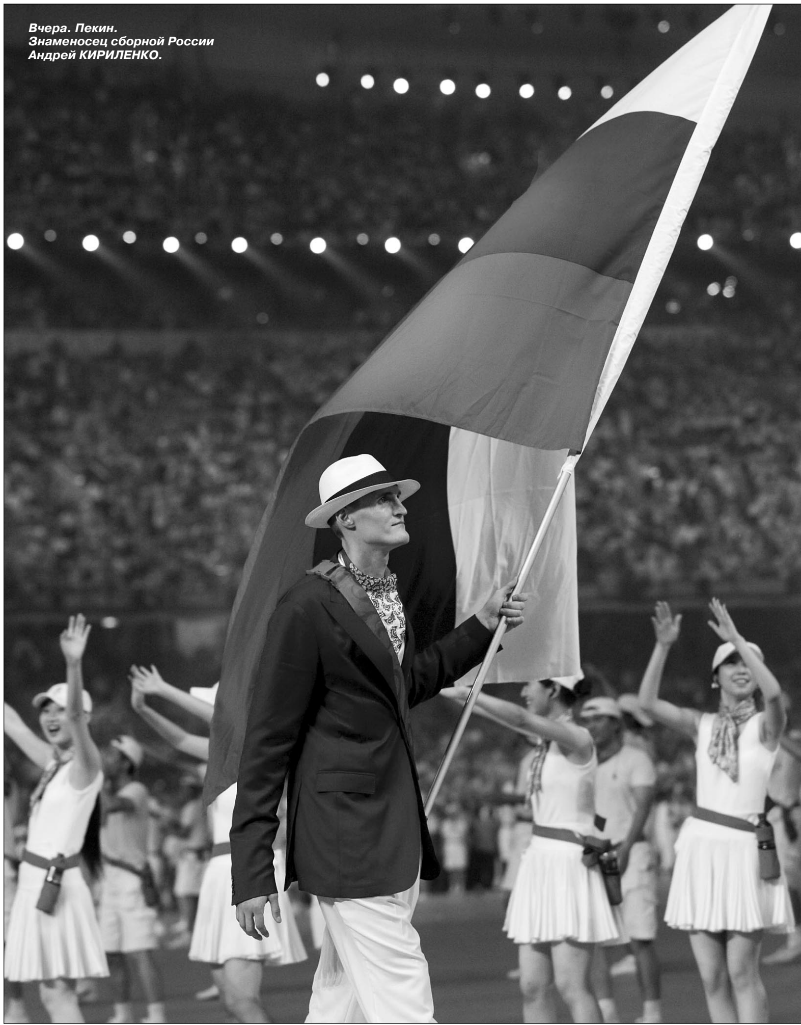
Вчера, Пекин. Знаменосец сборной России Андрей КИРИЛЕНКО.

Единственное, о чем жалею, - о том, что Южная и Северная Корея так и не прошли по стадиону единой командой. Не договорились. Жаль. Понючили бы уму-разуму у Большого Соседа.