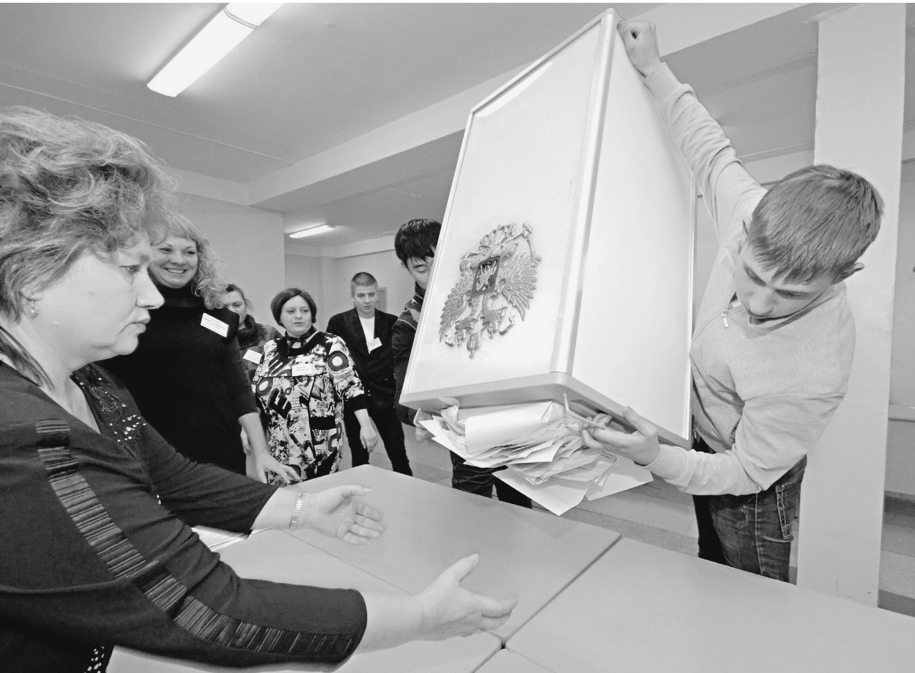
Подсчет голосов — самый драматичный момент на каждых выборах