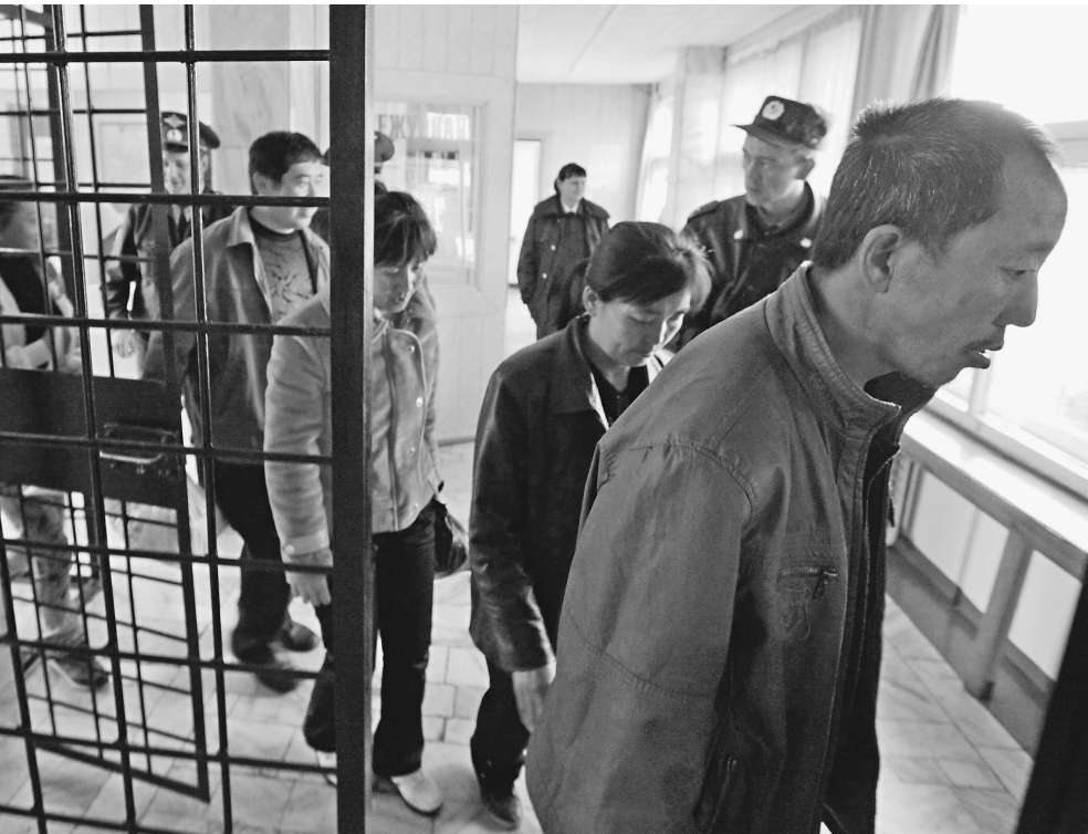
Количество китайских рабочих в столице снизилось за этот год на 70%, а вьетнамских — на 35%