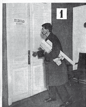
ДВЕРИ ДОЛЖНЫ РАСПЯТЫСЬ

Первый номер журнала «ИЗОБРЕТАТЕЛЬ» открывает статья Альберта Эйнштейна «Массы вместо единиц», где великий ученый говорит, что время гениальных изобретателей-одиночек прошло, наступает замечательная эпоха коллективного изобретательства. В этом новорожденном издании блистательный подбор авторов. Со статьями выступают крупные государственные и партийные деятели — В.Куйбышев, Л.Каменев, замечательные писатели — М.Пришвин, В.Шкловский, Н.Погодин, знаменитый журналист М.Кольцов, академики, выдающиеся инженеры и простые рабочие. Печатается бюллетень важнейших государственных решений по изобретательским делам, в том числе о привилегиях, помогавших тогдашним изобретателям жить и заниматься творчеством. Одним словом, это окно, через которое можно заглянуть в наше прошлое, срав-