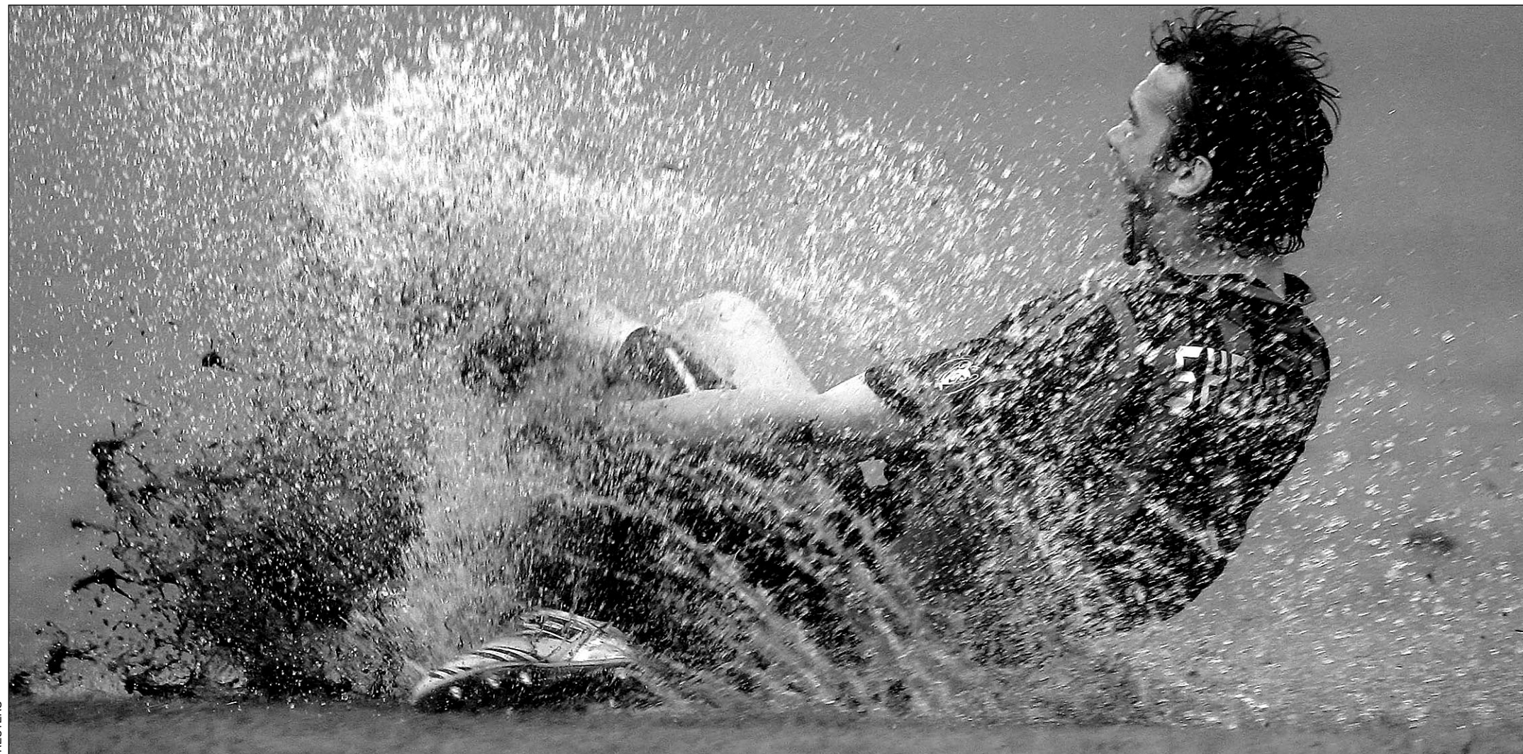
Андрей ШЕВЧЕНКО: воскресенье – гол в ворота «Асколи» на затопленном поле, понедельник – награда Golden Foot в Монако.

— Несмотря на скверные погодные условия, вам удалось