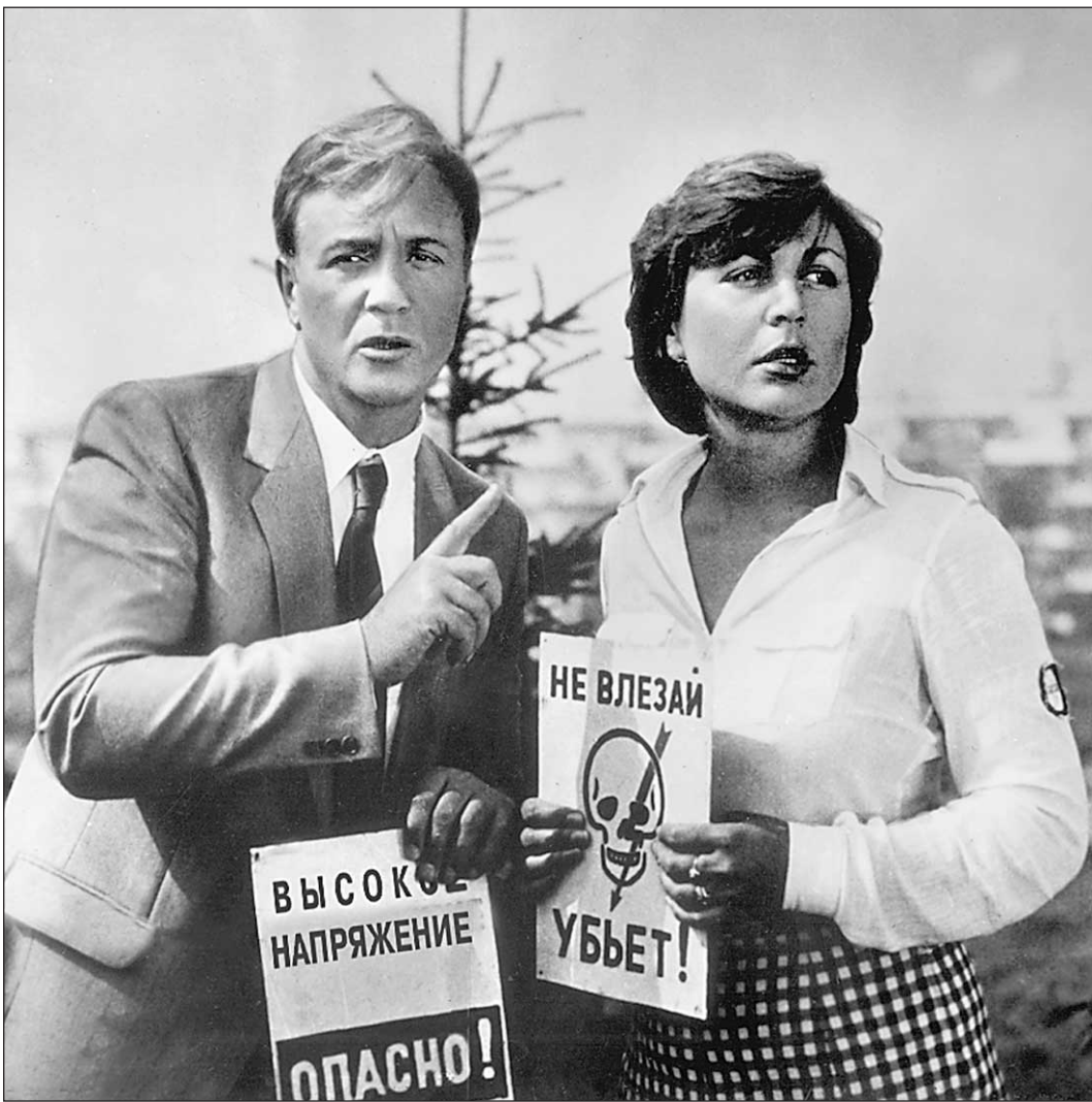
Кадр из фильма «Опасно для жизни!»