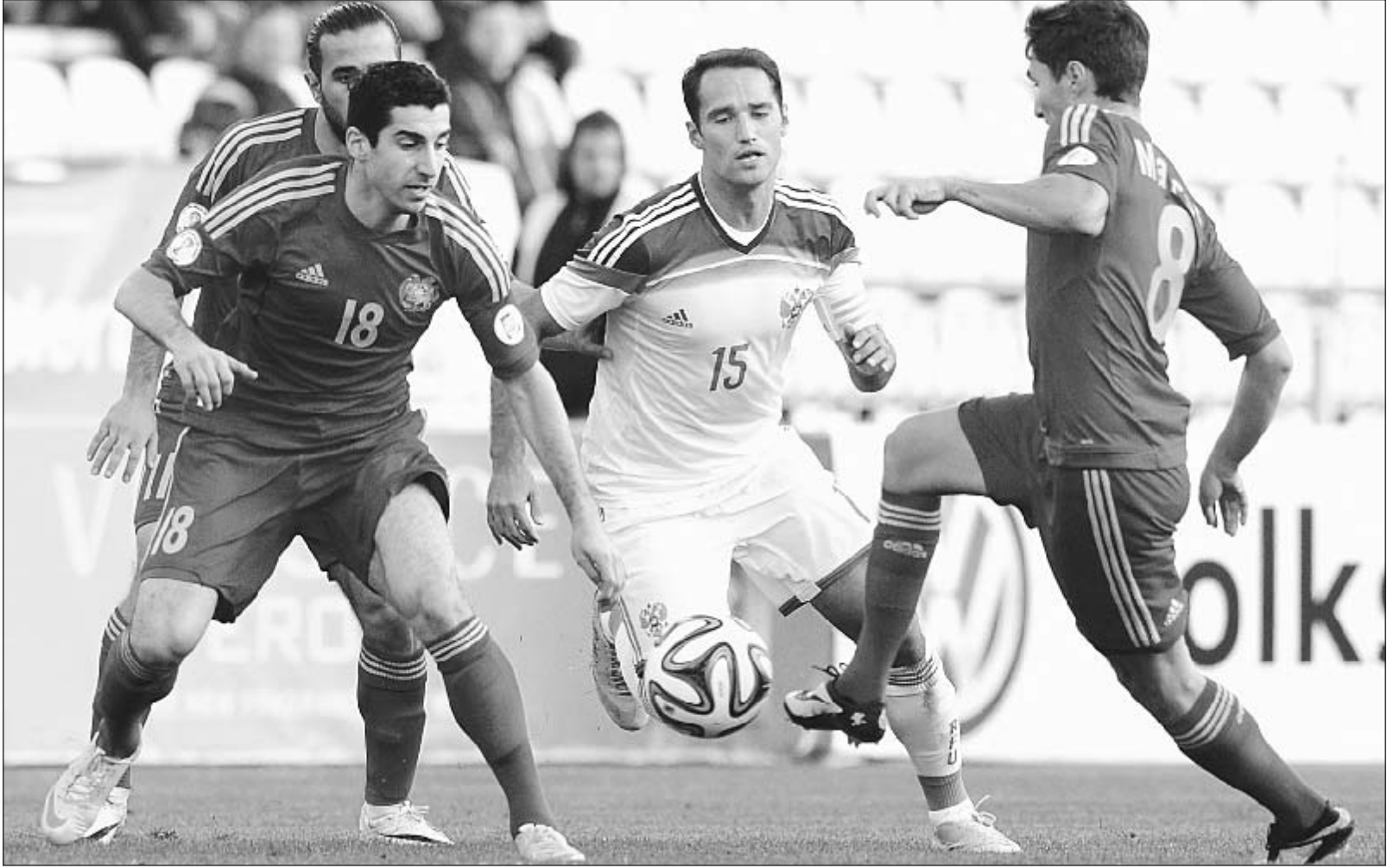
Вчера. Краснодар. Россия - Армения - 2:0. Капитан российской сборной Роман ШИРОКОВ против Генриха МХИТАРЯНА (№ 18) и Маркоса ПИЗЕЛЛИ.

но близки - Жирков и Акинфеев, несмотря на специфическое амплуа последнего. При этом слова «главный» и «ключевой» в данном контексте означают реальную отдачу и пользу, а вовсе не гарантированное место на поле из-за, к примеру, скудности тренерского выбора на тех или иных позициях. Чего еще не хотелось бы, но что было в Краснодаре, так это свету в завершающей стадии атаки. Ясно, что многое тут завязано на персональные класс и мастерство. А эти субстанции в последней стадии не корректируются, поскольку грани-