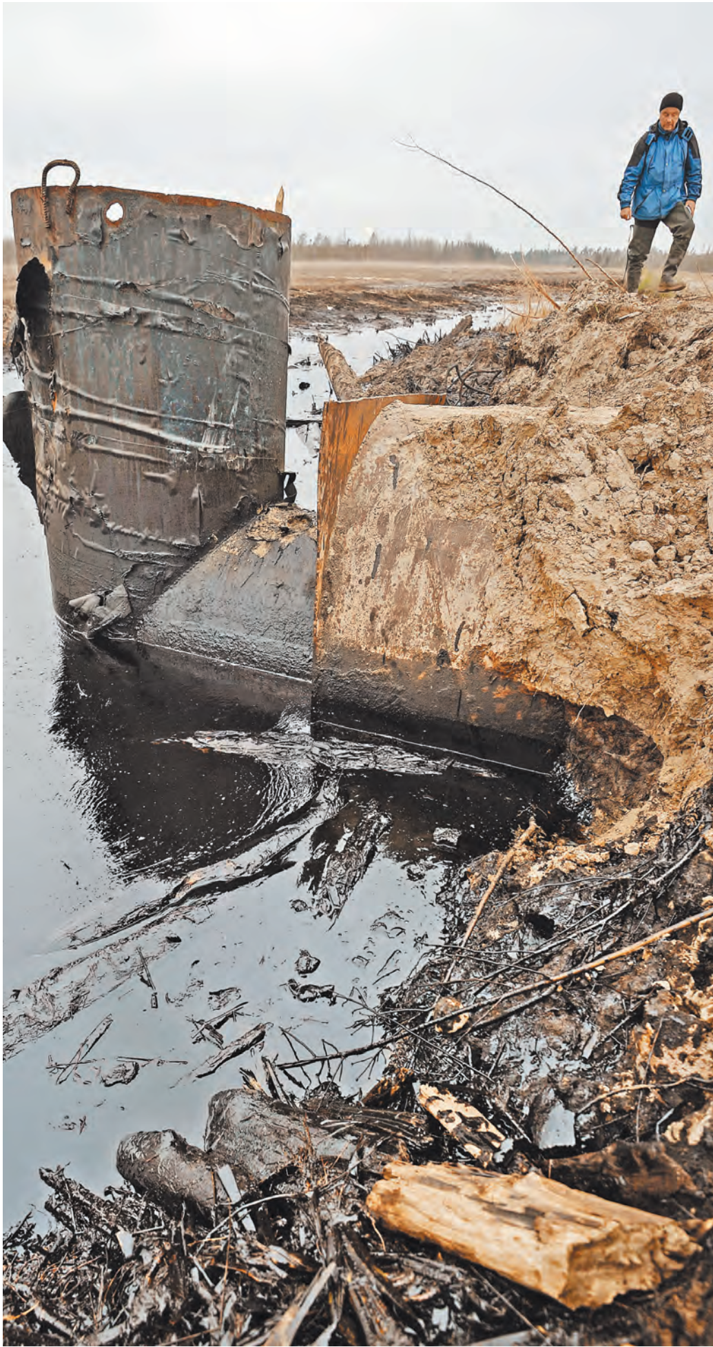
Ущерб экологии, нанесенный разливами нефти и нефтепродуктов, исчисляется миллиардами долларов.