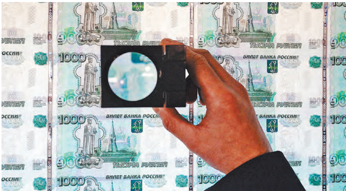
Финансовая разведка проверит, не отправлено ли почтой грязных денег.