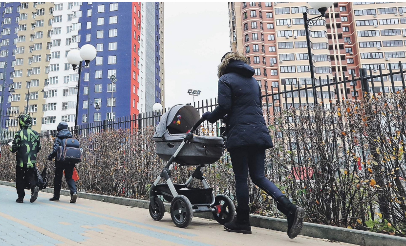
Михаил Терещенко / Известия