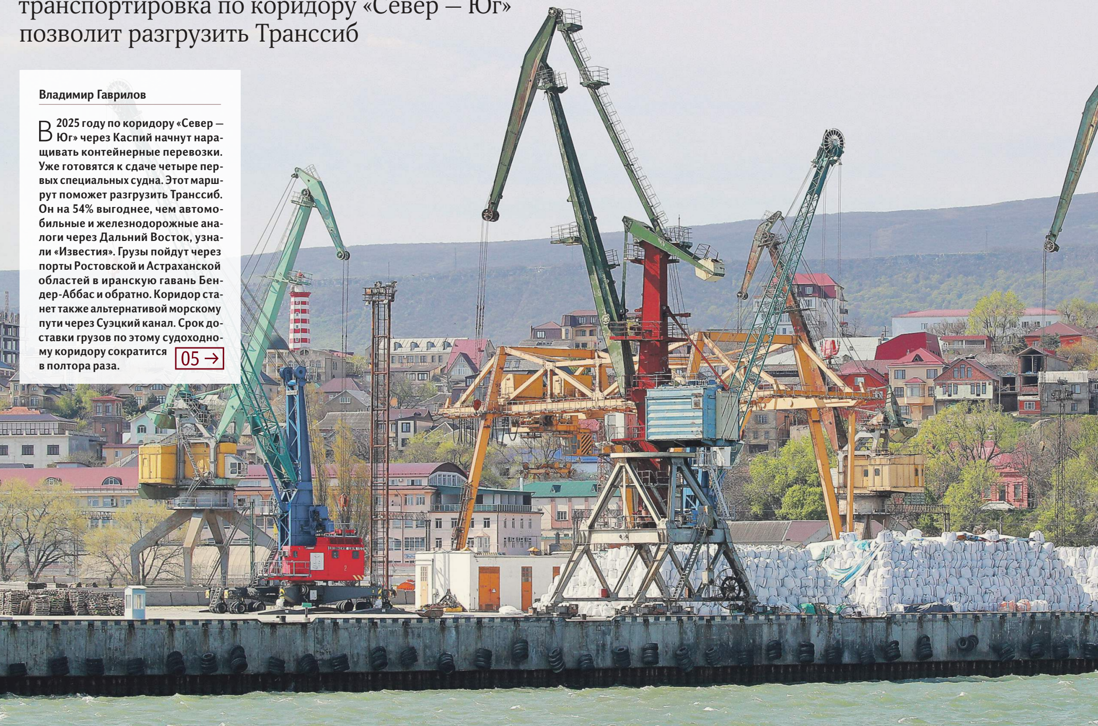
Порты Каспийского моря оснастят всем необходимым для приёма контейнеровозов (на фото — Махачкалинский международный морской торговый порт)