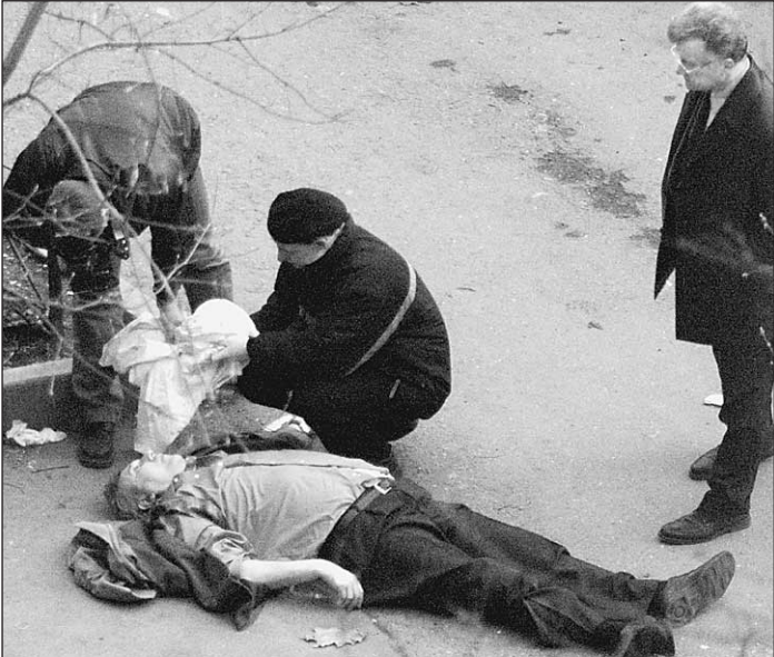
17 апреля 2003 года. Место убийства депутата Юшенкова