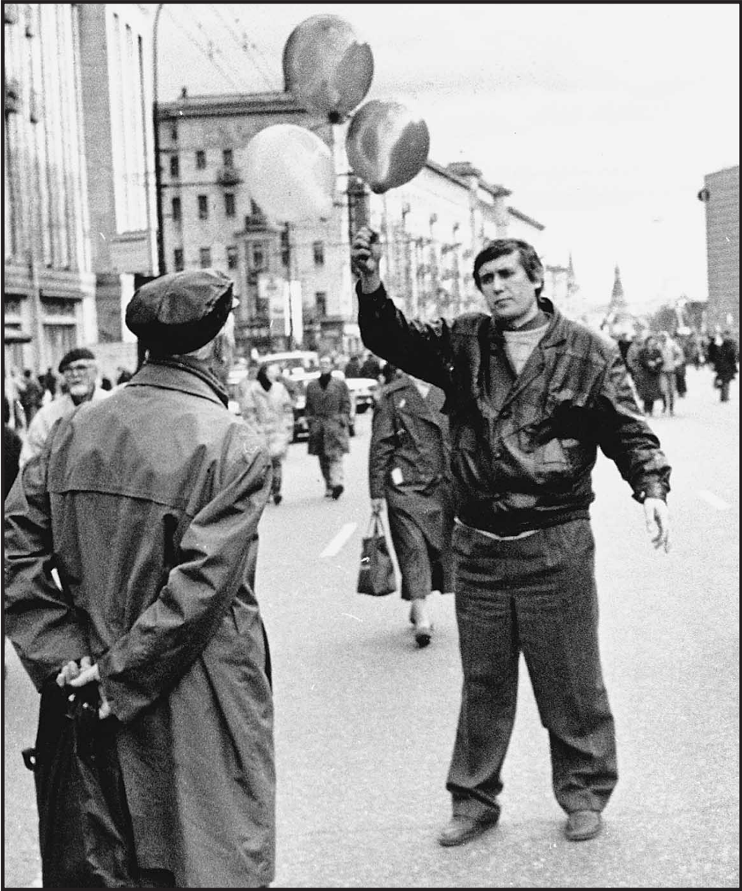
1 мая 1992 года. Сергея Юшенкова называли последним романтиком российской демократии

Юшенков впервые на парламентскую трибуну поднялся на съезде Верховного Совета РСФСР. Работал в ВС РСФСР, где последовательно и эмоционально отстаивал линию Ельцина. Защищал Белый дом в 91-м и приветствовал его расстрел в 93-м. Встал в оппозицию «режиму Ельцина» Юшен-