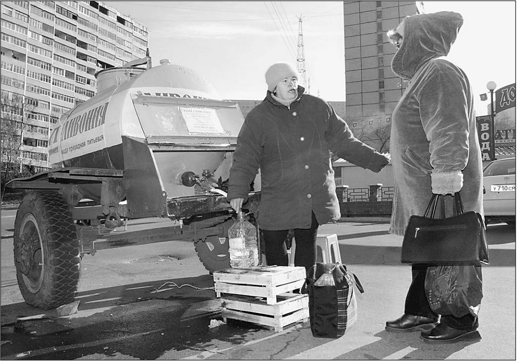
11 ноября. Бизнес на воде во Владивостоке — самый прибыльный