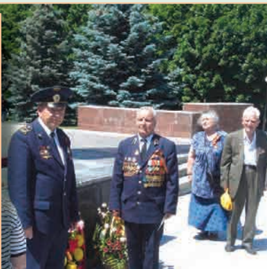
▲ Возложение венков к памятнику павшим героям в г. Курске