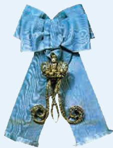
Нагрудный шифр гофдамы при дворе императрицы Марии Фёдоровны