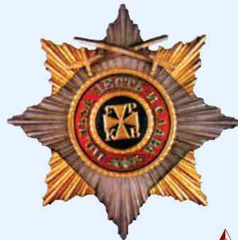
Звезда ордена Св. Владимира с мечами. Серебро, золочение, период до 1899 г.