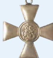
Георгиевский крест с веточкой