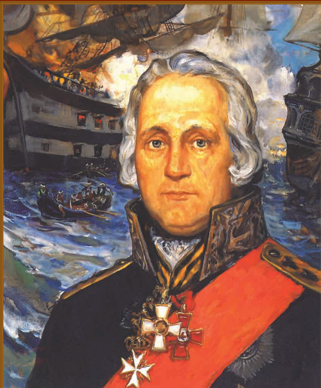
Ф.Ф. Ушаков Художник В.М. Сибирский, 1992 г.

15 октября – День памяти святого праведного воина адмирала Ф.Ф. Ушакова