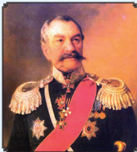
Портрет генерал-лейтенанта Донского казачьего войска 1867 г. Неизвестный художник