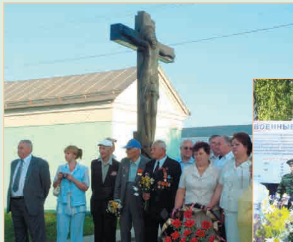
Станция Мармыжи. ▲ Митинг у Поклонного креста на братской могиле советским воинам