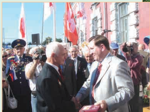
Губернатор Курской области ▲ А.Н. Михайлов вручает памятные медали "65 лет Курской битвы"