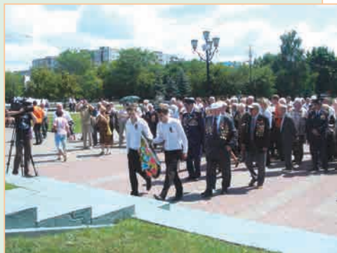
▲ Ветераны и молодёжь возлагают венок и цветы к памятнику павшим героям в г. Белгороде