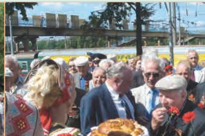
▲ Участники Поезда Памяти в Старом Осколе