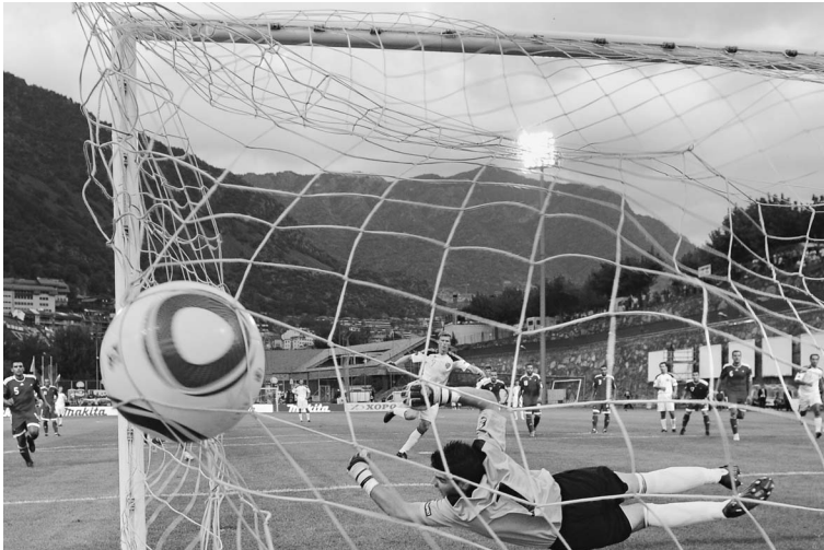
3 сентября 2010 года. Андорра—Россия — 0:2. Игрой нашей сборной в уходящем году болельщики остались вполне довольны

ВАЙНШТЕЙН: В будущем году, кстати, исполняется 20 лет с рождения суверенного российского футбола, который независимо существует после постсоветского. Полагаю, интересно из прошлого через настоящее взглянуть в будущее. На данный момент существуют два метода оценки. Первый предназначен для внутреннего рынка потребления — это чемпионат России.