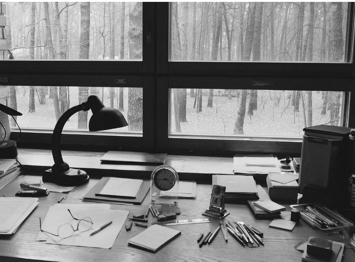
Рабочий стол Александра Солженицына. Троице-Лыково. Декабрь 2010 года