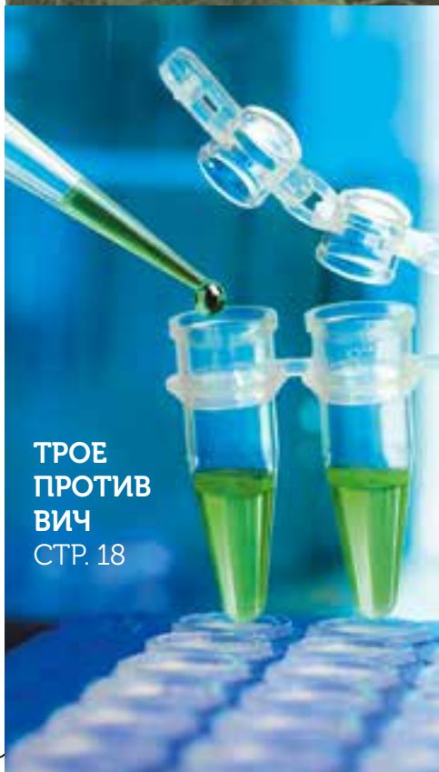
ТРОЕ ПРОТИВ ВИЧ СТР. 18