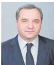
ВЛАДИМИР ПУЧКОВ, глава МЧС России:

— МЧС России уделяет особое внимание социальной защите личного состава боевых подразделений. Планируем, несмотря на трудности, повышать уровень заработной платы, обеспечивать жильем и решать ряд других важных вопросов социального обеспечения каждого, кто служит или работает в системе МЧС России.