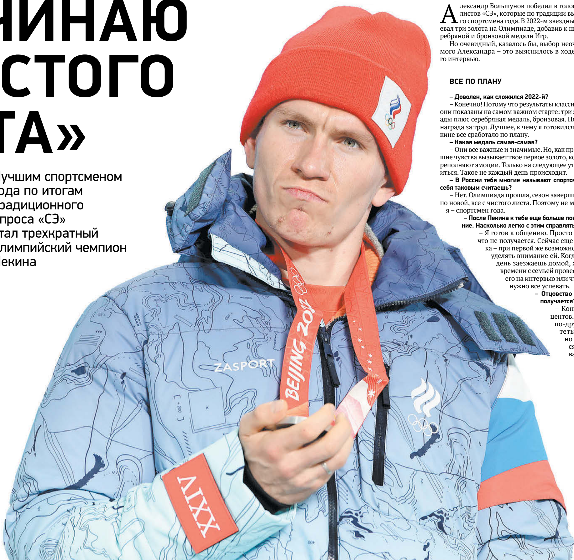
19 февраля. Пекин. Пока главные соревнования в карьере Александра Большунова – есть три олимпийских золота!

Лучшим спортсменом года по итогам традиционного опроса «СЭ» стал трехкратный олимпийский чемпион Пекина