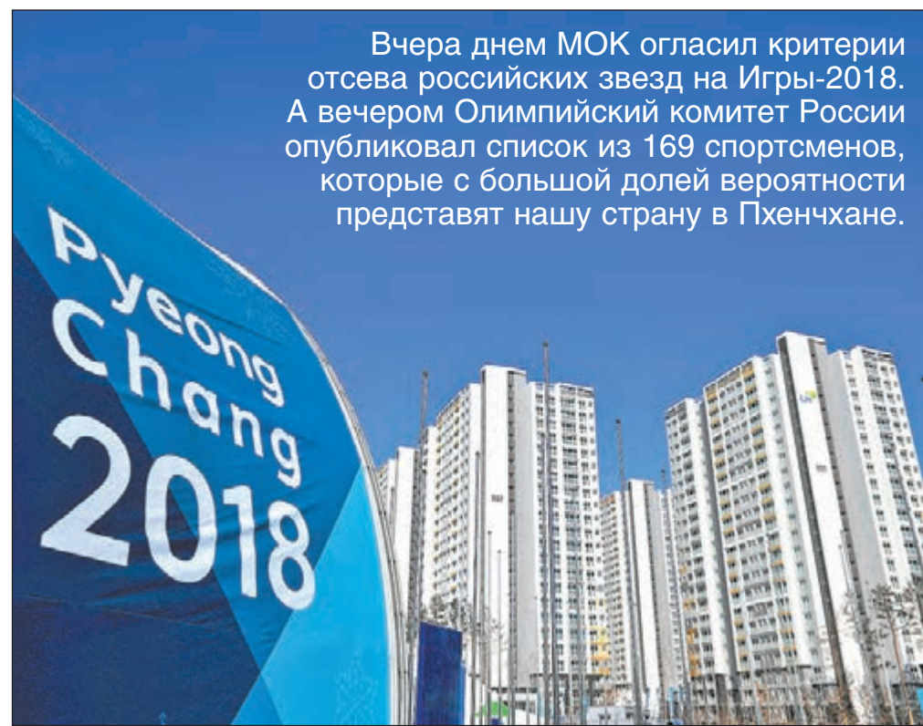
Вчера. Пхенчхан. Вид на олимпийскую деревню.