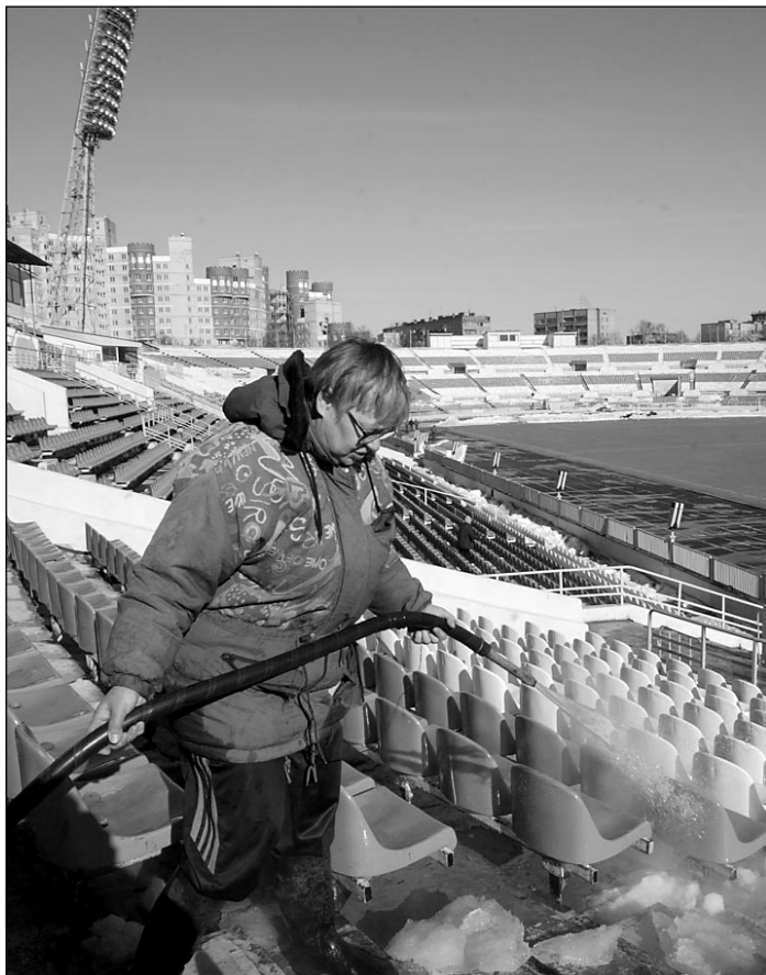
Вчера. Москва. Стадион «Динамо». К старту чемпионата снег сам растаять не успеет - ему надо помочь!

НА «ДИНАМО» ВСЕ ПО-РУССКИ: АВРАЛ В ПОСЛЕДНИЙ ДЕНЬ