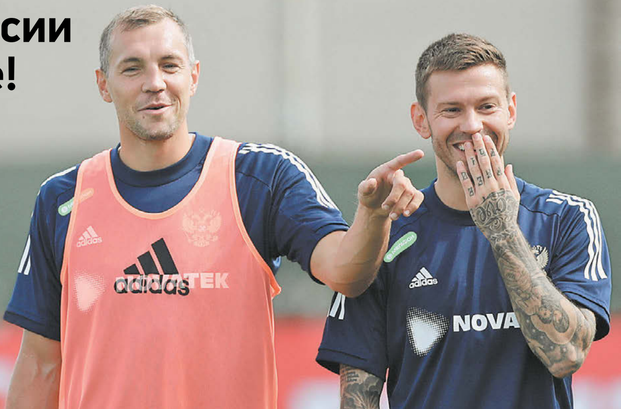
Вчера. Новогорск. Артем Дзюба и Федор Смолов (справа)