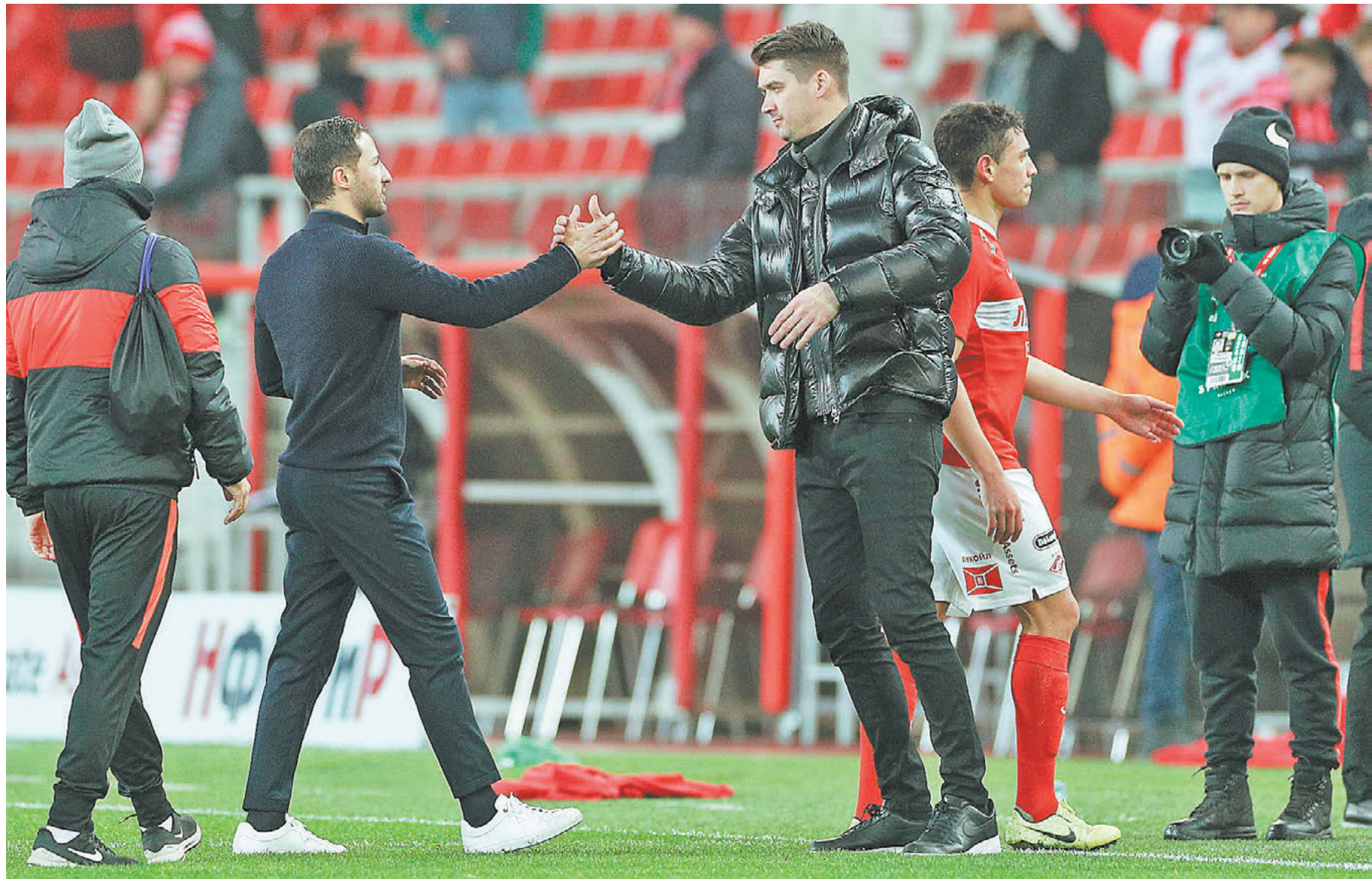
4 ноября 2019 года. Москва. Тушино. «Спартак» – «Арсенал» – 0:1. Томас Цорн (третий слева) и Доменико Тедеско

Эксклюзивное интервью бывшего генерального директора красно-белых