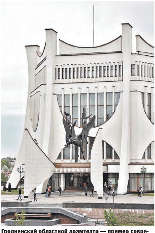
Гродненский областной драмтеатр — пример современной архитектуры.

Конкурсные заявки, составленные в соответствии с требованиями конкурсной документации, должны быть доставлены по вышеуказанному адресу не позднее 11 час. 00 мин. 9 июня 2014 года (время московское). Конкурсные заявки должны быть составлены по форме и в порядке, соответствующим конкурсной документации. Вскрытие конвертов с конкурсными заявками состоится в 11 час. 00 мин. 9 июня 2014 года (время московское) по адресу: 103132, г. Москва, Старая площадь, д. 8/5, подъезд №3, Департамент социальной политики и информационного обеспечения Постоянного Комитета Союзного государства.