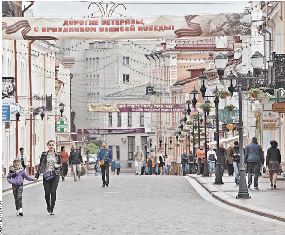
Пешеходная улица Гродно (улица Советская) — аналог московского Арбата.