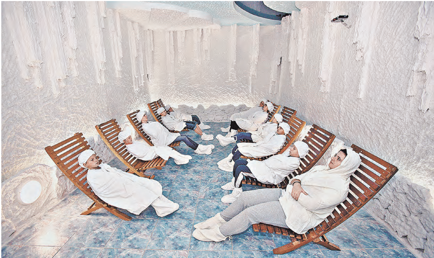
В детском реабилитационно-оздоровительном центре «Жемчужина» скучать не приходится.