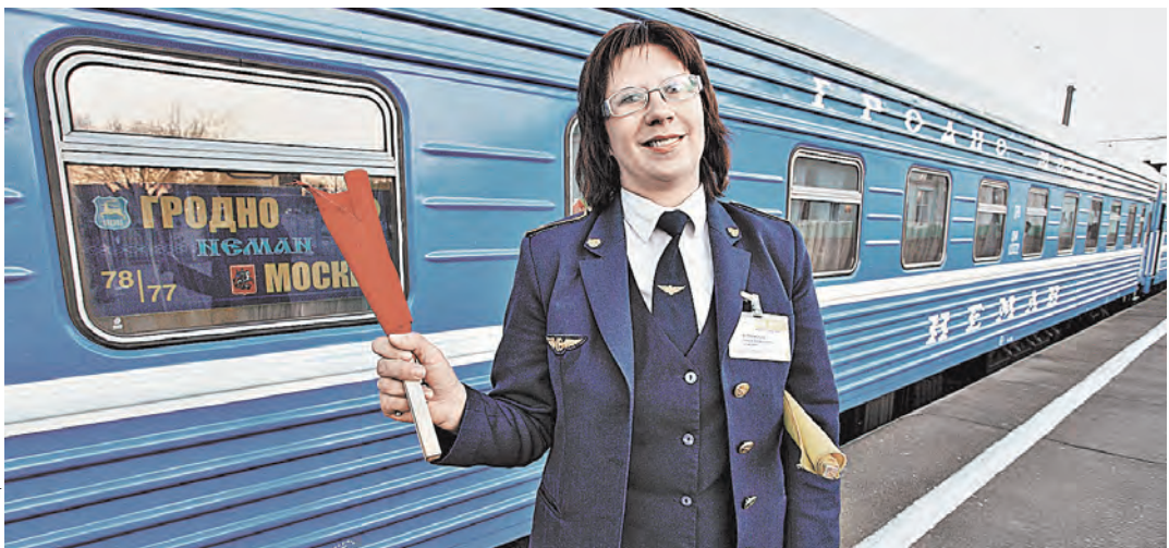
Поезд из Москвы до Гродно идет чуть более 16 часов.

Э тот год Гродно проведет в статусе культурной столицы Беларуси. В прекрасном старинном городе на Немане пройдет множество акций и мероприятий. Накануне одного из самых значимых и ярких событий — десятого, юбилейно-