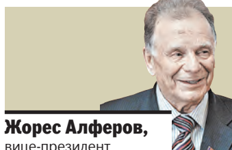
Жорес Алферов, вице-президент Российской академии наук:

УЧАСТНИКИ шестой белорусской антарктической экспедиции вернулись в Минск. Белорусские полярники впервые работали на российской станции «Прогресс», введенной в строй два года назад. Ледяная вахта длилась около полугодя. За это время белорусские зимовщики провели подспутниковые дистанционные наблюдения во время пролета белорусского космического аппарата над Антарктидой.