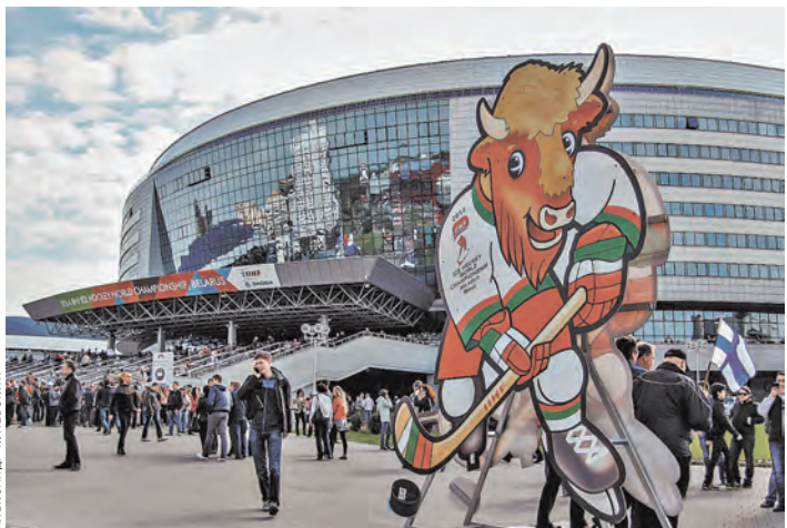
Большечиков приехало столько, что они могли бы заполнить сразу несколько «Минск-Арен».

Чемпионат мира преобразил жизнь белорусской столицы и изменил жизненный ритм минчан. В последние перед приездом гостей дни все службы в сотый раз проверили готовность, и, наверное, поэтому праздник получился на все сто. По-европейски чинно и респектабельно выглядят одежде в строгие жилеты и рубашки водители общественного транспорта, продающие в магазинах широко улыбаются разнаряженным фанатам, загружающим в тележки белорусское пиво. Как родных встречают гостей студенты-волонтеры в ярких майках и кепочках. Готовы ответить на любой вопрос и лично проводить, куда те пожелают. Даже обычно суровые блюстители порядка стали добрее и пристальный интерес к