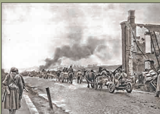
Советские войска после ожесточённых боёв вступают в Ельню 8 сентября 1941 г.