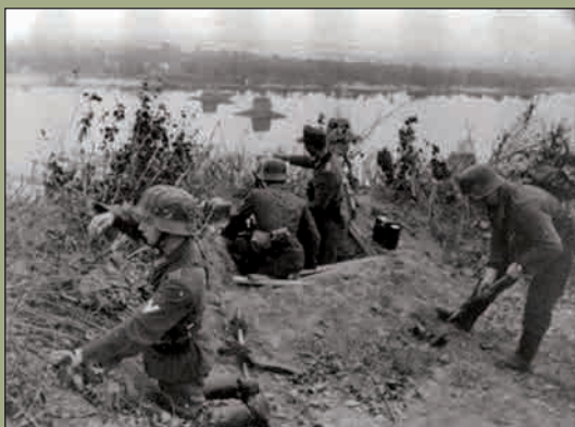
Немецкий рубеж обороны под Ельней