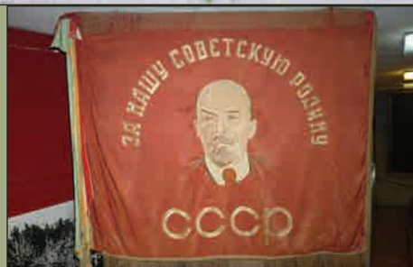
Гвардейское знамя 2-й гвардейской (бывшей 127-й) стрелковой дивизии (лицевая сторона)