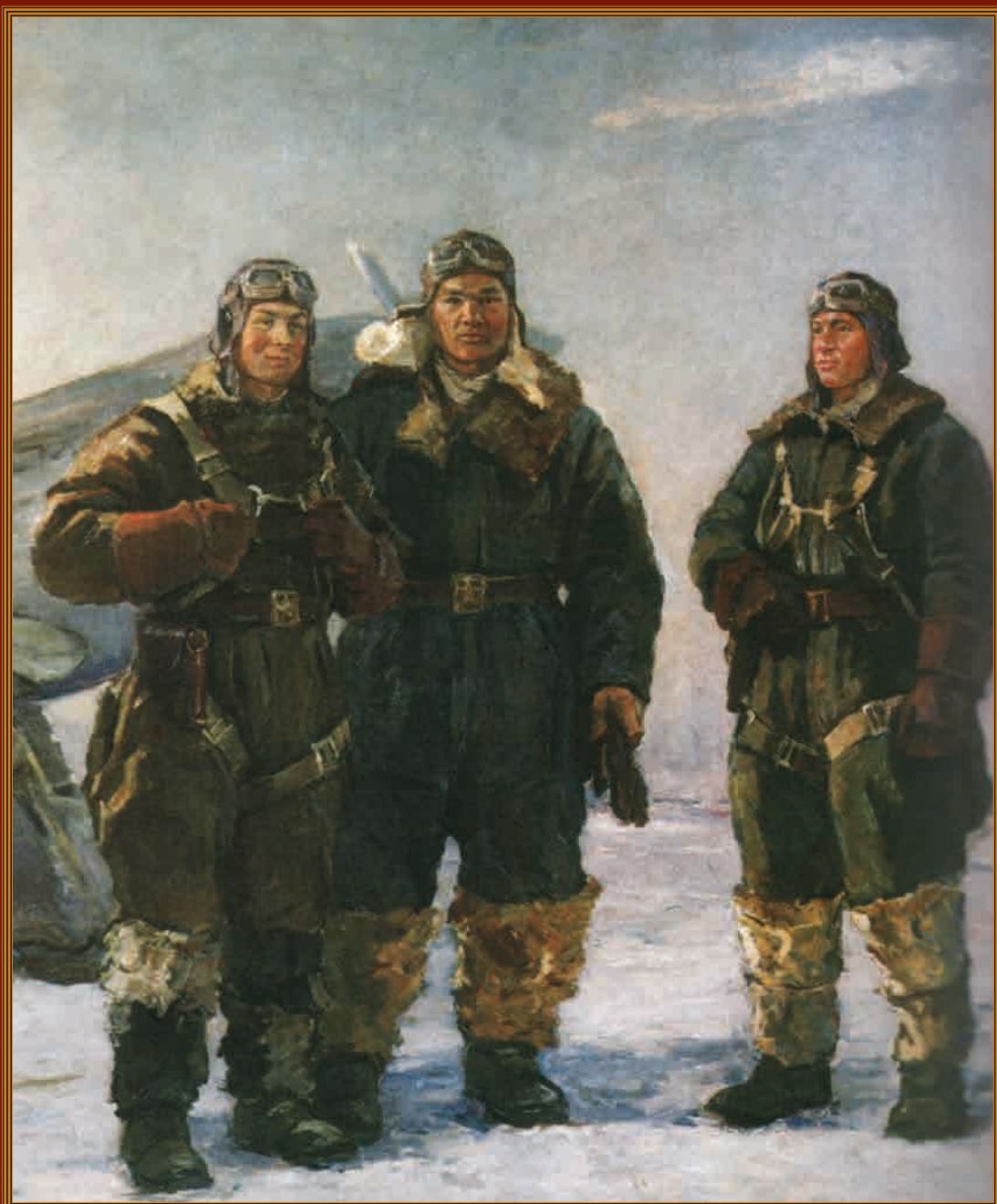
Три Ивана Художник Ф.В. Антонов 1942 г.

12 августа — День Военно-воздушных сил России