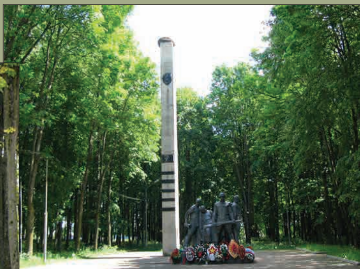
Памятник Советской Гвардии, рождённой в боях под Ельней