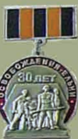
Памятный знак к 30-летию освобождения Ельни