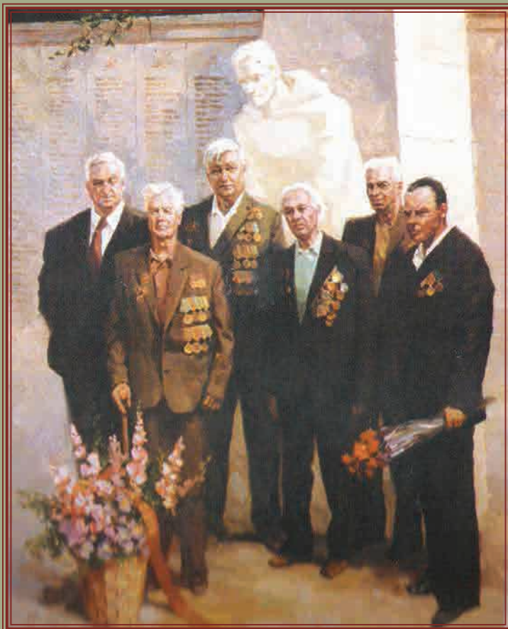
Ополченцы, оставшиеся в живых после боёв под Ельней, на Площади Победы г. Красноармейска Художник Г.Я. Демин