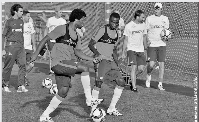
Вчера. Тарасовка. ЗЕ ЛУИШ и Квинси ПРОМЕС (в центре) готовятся к матчу с «Рубином», который пройдет в понедельник.

Интервью Боккетти - в ближайших номерах «СЭ», репортаж наших корреспондентов с тренировки «Спартак» - стр. 3