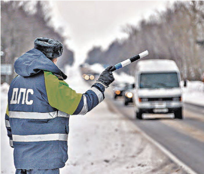
Скорость на белорусских дорогах — дорогое удовольствие.