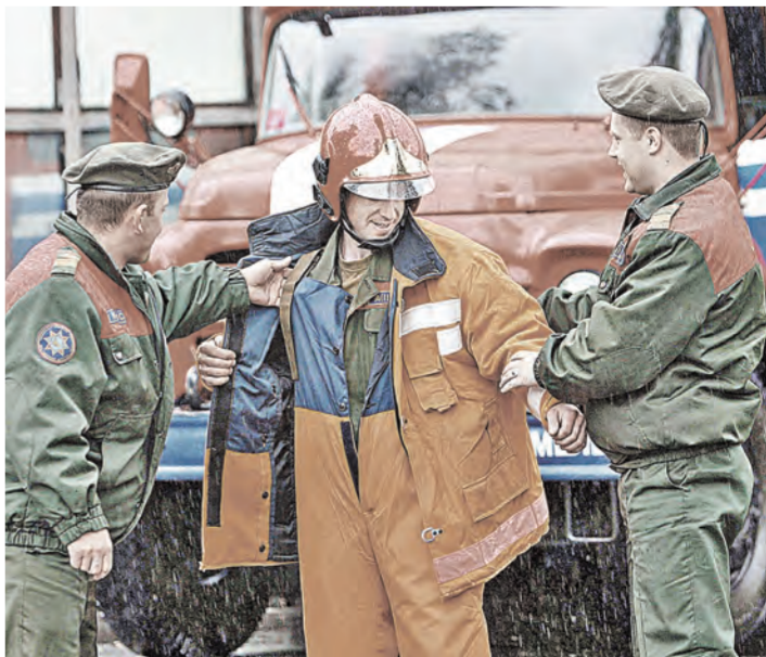
Такому защитному костюму из «Арселона» не страшны ни огонь, ни вода.

Нынешняя союзная программа продлится по 2016 год. В результате выполнения предыдущей программы по созданию и специальных химических волокон, и оборудования для их производства были разработаны 64 технологических процесса, 125 видов оборудования, получено 25 патентов.