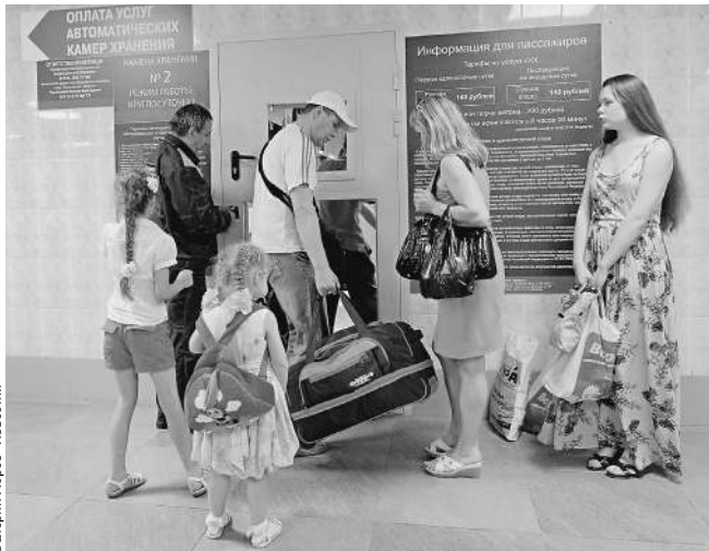
Содержимое камер хранения тоже может оказаться со временем в бюро находок

— Отыскать забытые вещи можно будет либо через отдельный сервис, либо через соответствующий раздел на веб-страничках вокзалов, — сказал он. — Также пассажирам предоставят возможность в режиме онлайн забронировать место в комнатах длительного отдыха — по сути, в гостиничных комплексах, которые есть на каждом московском вокзале, за исключением Савеловского и Рижского. Помимо прочего через элек-