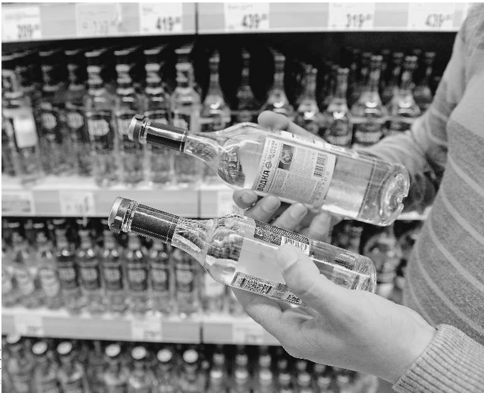
Водочная розница показала тенденцию к минимализму