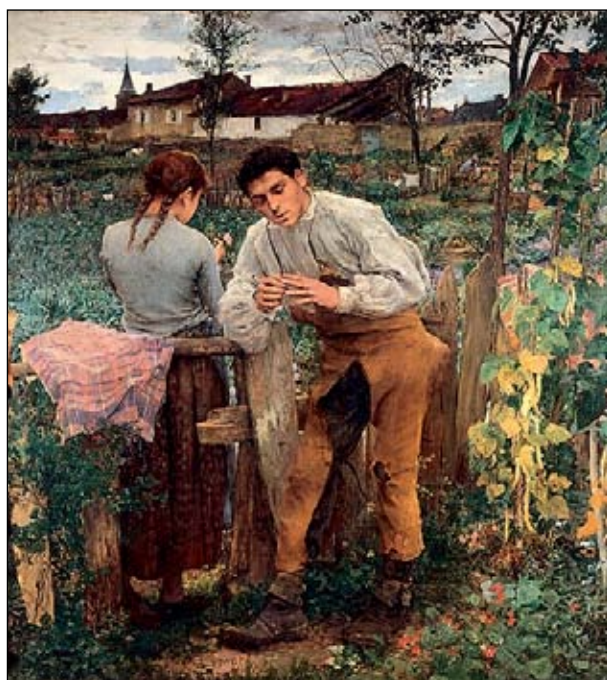
— Жюль Бастьен-Ленаж. Деревенская любовь. 1882. —