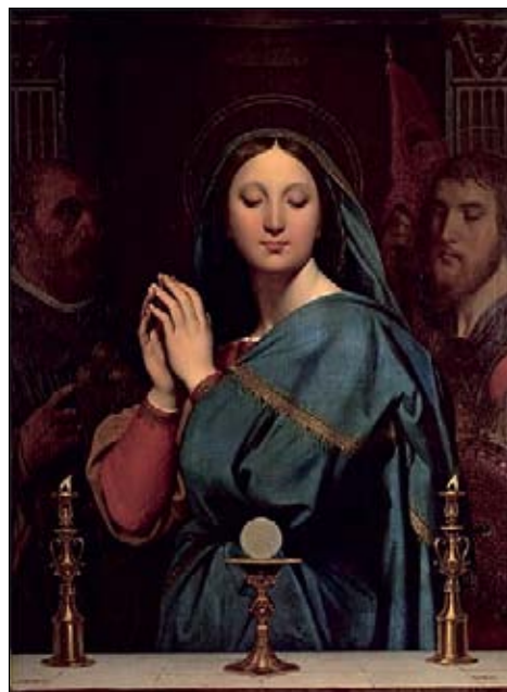
Жан Огюст Доминик Энгр. Мадонна перед чашей с причастием. 1841. —