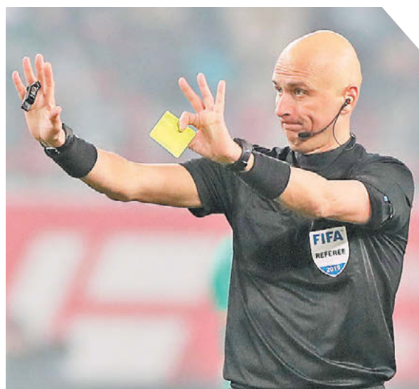
Александр Федоров «СЗ» / Canon EOS-1DX Mark II